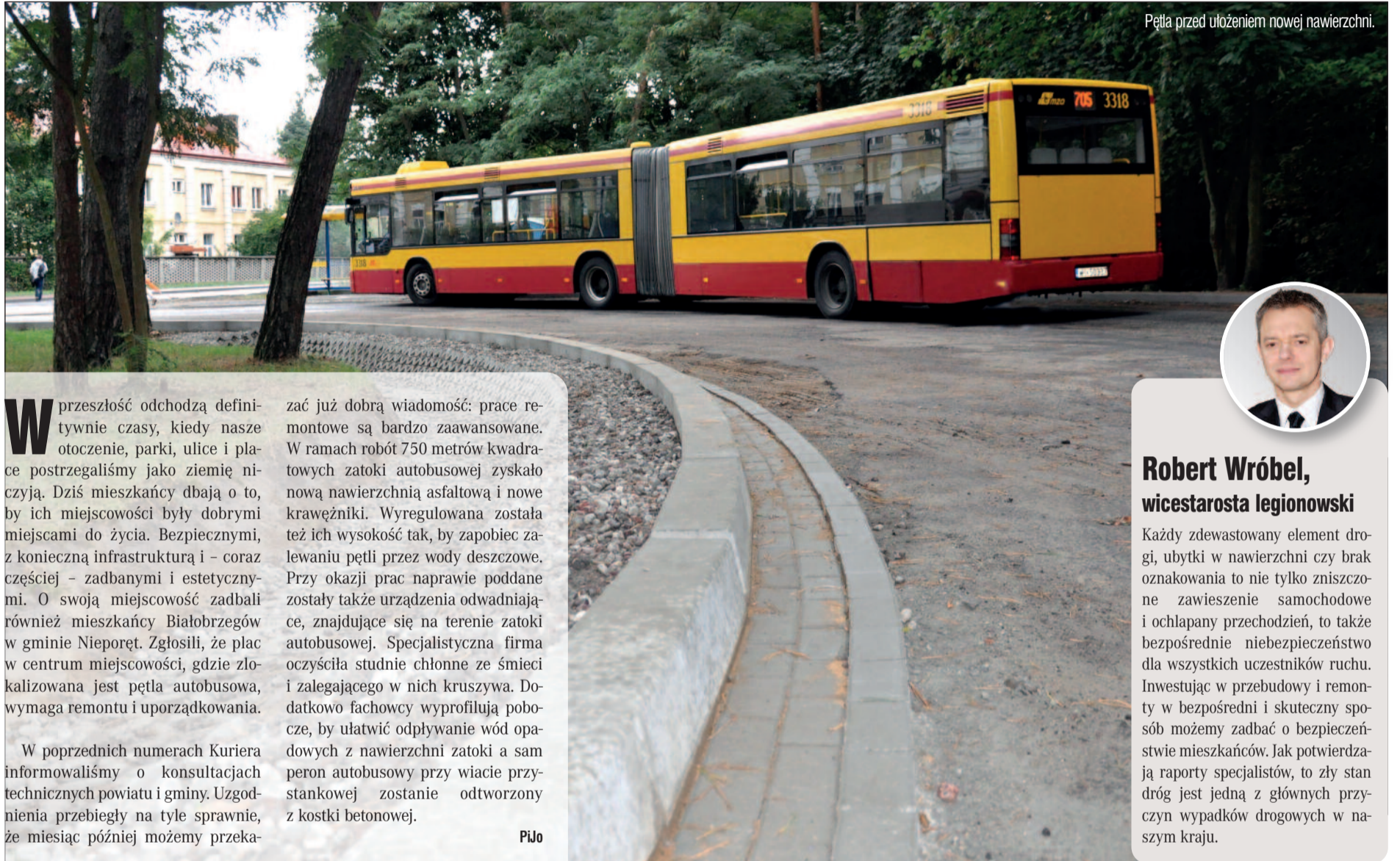
Pętla przed ułożeniem nowej nawierzchni.

Kolejny raz współpraca powiatu i gminy Nieporęt zaowocowała szybkim i skutecznym działaniem. Prace modernizacyjne w centrum Białobrzegów mają się ku końcowi.