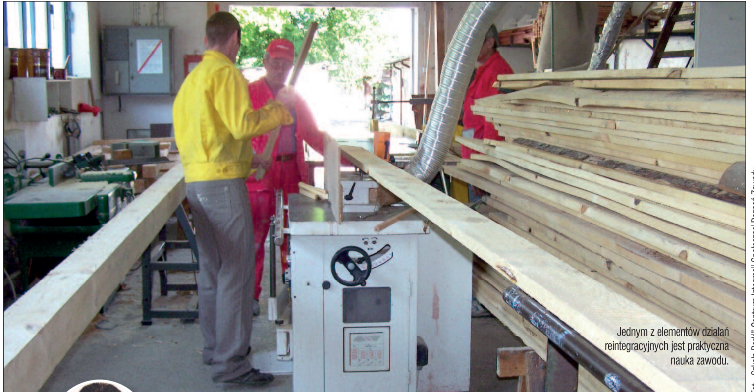
Jednym z elementów działań reintegracyjnych jest praktyczna nauka zawodu.

Osoby, którym ma pomagać CIS, to mieszkańcy powiatu zagrożeni wykluczeniem społecznym z powodu braku pracy. Wybrani zostaną spośród osób długotrwale bezrobotnych w wieku aktywności zawodowej, czyli pomiędzy 15 a 64 lata. Grupa, która zostanie