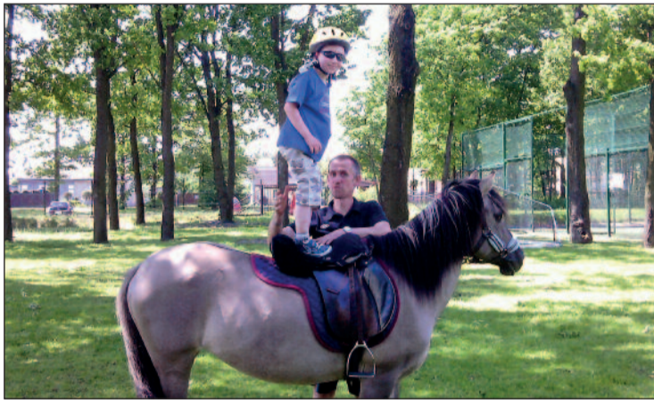
Leczenie autyzmu wspomaga m.in. hipoterapia.

Jak rozpoznać autyzm u naszego dziecka? Co powinno nas zaniepokoić? Gdzie diagnozować dziecko i szukać terapii? Postaramy się odpowiedzieć na te pytania.