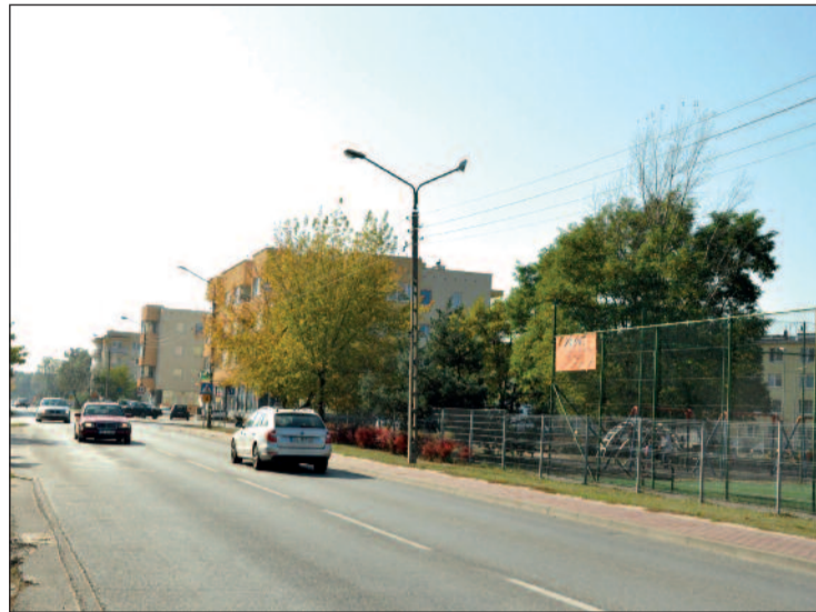
Na Suwalnej zbudowany zostanie chodnik. Będzie też dodatkowe przejście dla pieszych przy ulicy Jaśminowej.

Tak – to zasługa starostów, którzy dbają, aby wykonując inwestycję zadbać o jej kompleksowość. W przypadku Suwalnej najważniejsze było bezpieczeństwo. Stąd rozszerzenie wykonywanych robót. W miejscu przystanku autobusowego (naprzeciwko boiska) powstanie zatoka autobusowa. Pasażerowie będą przez Suwalną na wysokości Olszankowej przechodzili przez przejście dla pieszych z azylem – miejscem na ulicy w którym można się bezpiecznie zatrzymać. Powstanie przejście dla pieszych przez ulicę Olszankową. Odnowione zostaną znaki drogowe. Postawione tzw. „Agatki” – znaki informujące o uczęszczaniu drogi przez dzieci. Dodatkowo w miejscach w których zbiera się woda wykonany zostanie drenaż z sączkami podchodnikowymi. Już 20 października odbędzie się przetarg na wykonawcę tej inwestycji i jeszcze w tym roku rozpocznie się jej realizacja.