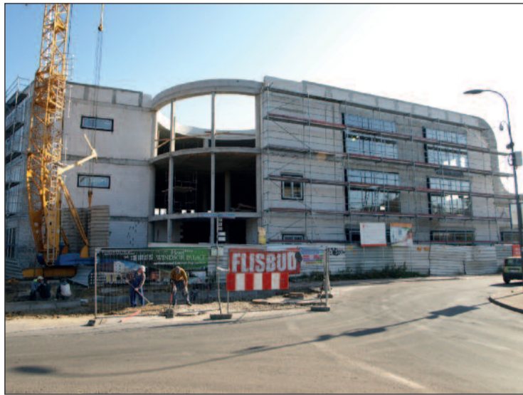
Budowa Centrum Komunikacyjnego w Legionowie.

Rozbudowa Powiatowego Zespołu Szkół i Placówek Specjalnych to jedna z najważniejszych powiatowych inwestycji. Dobudujemy cztery nowe sale dydaktyczne, pomieszczenia techniczne, modernizujemy budynek i otoczenie. Najważniejsze jednak, że dzięki inwestycji powstanie dodatkowy oddział przedszkolny, w którym miejsce znajdą kolejni niepełnosprawni uczniowie z naszego powiatu. Oni, ich rodziny, czekają na zakończenie prac, dlatego nie możemy sobie pozwolić, by roboty trwały w nieskończoność i były prowadzone w nieodpowiedni sposób. Już są spore opóźnienia, a gdybyśmy nie podjęli odpowiednich kroków, dzieci czekałyby w nieskończoność, a inwestycja trwała latami. Dlatego rozwiązaliśmy umowę z wykonawcą i chcemy jak najszybciej wybrać nową, odpowiednią, mam nadzieję, firmę, która jak najszybciej dokończy rozbudowę placówki przy Jagiellońskiej.