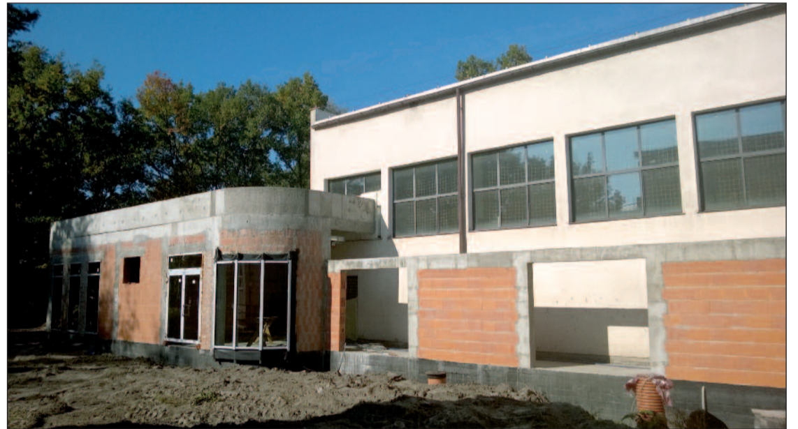
Rozbudowa Powiatowego Zespołu Szkół i Placówek Specjalnych.

kają rodzice niepełnosprawnych dzieci z całego powiatu. W nowych pomieszczeniach mieścić się będzie m.in. przedszkole specjalne, przybędą nowe miejsca dla najmłodszych. Władze powiatu od początku kładły ogromny nacisk na sprawne, szybkie prowadzenie prac i jak najmniejsze utrudnienia związane z inwestycją. Niestety, wykonawca nie zdążył już z pierwszym etapem inwestycji, jakim była termomodernizacja istniejącego budynku. Powiat naliczył kary umowne. Mimo zapewnień, że sytu-