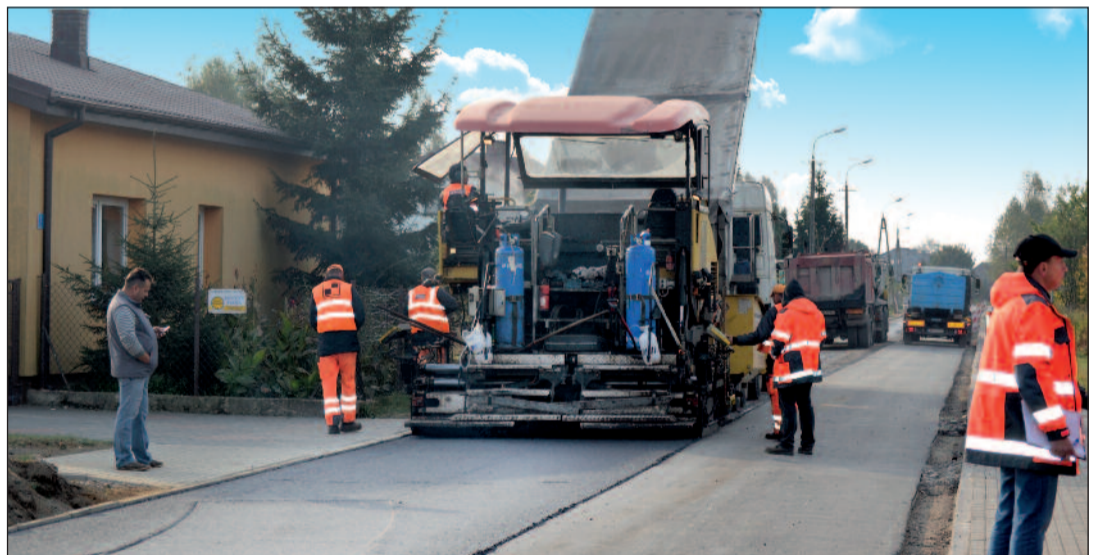
W chwili wydania Kuriera kładzono warstwy asfaltowe.

Mieszkańcy Aleksandrowa i Nieporętu już wkrótce będą mogli korzystać z ponad czterech kilometrów nowej drogi. Ku końcowi zmagają prace na powiatowym ciągu ulic Królewska-Zwycięstwa.