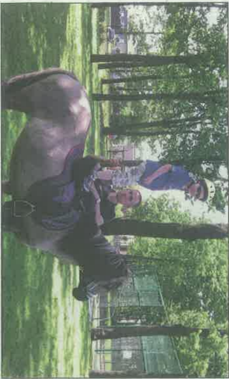
Leczenie autyzmu wspomaga m.in. hipoterapia.

Jak rozpoznać autyzm u naszego dziecka? Co powinno nas zaniepokoić? Gdzie diagnozować dziecko i szukać terapii? Postaramy się odpowiedzieć na te pytania.