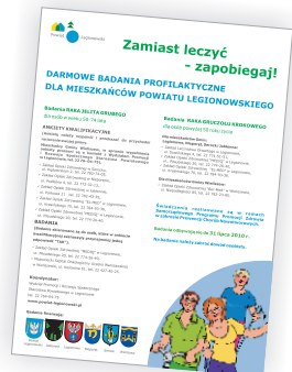
ogłoszenie do prasy (2010)

Informacje dla mieszkańców powiatu legionowskiego o bezpłatnych świadczeniach realizowanych w ramach Programu, promowane były na billboardach i plakatach oraz w ulotkach, dołączonych do imiennych zaproszeń. Projekty graficzne materiałów opracowane zostały przez Wydział Promocji i Rozwoju Społecznego Starostwa Powiatowego w Legionowie. Założenia Programu publikowane były w lokalnych mediach, a także ogłaszane w parafiach.