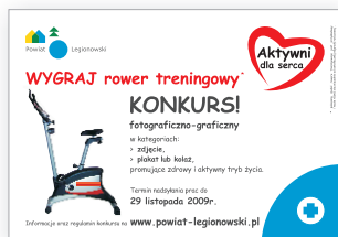
plakat i ogłoszenie w lokalnej prasie

Do konkursu zgłoszono 26 prac. W pierwszym etapie Komisja Konkursowa wyłoniła 4 zdjęcia i 5 prac w kategorii "plakat, kolaż". Drugim etapem było głosowanie internautów za pomocą serwisu www.powiat-legionowski.pl .