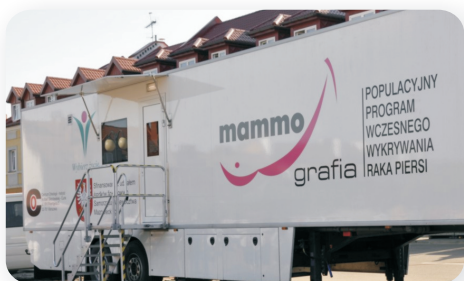
cytomammobus na serockim rynku (2009)

Profilaktyka raka szyjki macicy nie ograniczyła się jedynie do badań. Dla dziewcząt w wieku 11-18 lat został przygotowany pilotażowy program szczepień ochronnych przeciwko zakażeniom HPV. W 2009 roku, dzięki współpracy z Powiatowym Centrum Pomocy Rodzinie w Legionowie, zaszczepione zostały 42 dziewczynki z rodzin zastępczych. W 2010 roku natomiast, szczepienia adresowane były do 11 i 12 - latek wychowujących się w rodzinach wielodzietnych. Łącznie w Programie zostało zaszczepionych 101 dziewcząt.