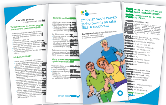
ulotki informacyjne (2009-2010)