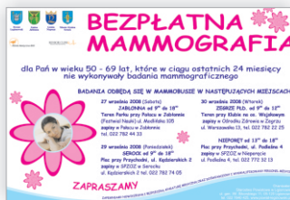
plakat informacyjny (2008)