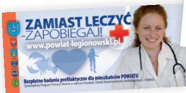
kampania billboardowa (2008)