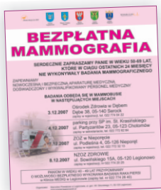
plakat i ogłoszenie (2007)