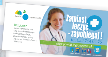
kampania billboardowa (2009)