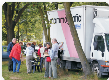
mammobus w gminie Jabłonna (2009)

Profilaktyka raka piersi oparta jest przede wszystkim na samokontroli. U kobiet, które regularnie badają biust, wykrywalność nowotworu jest znacznie większa niż u tych, które tego badania nie wykonują.