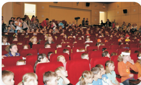
finał konkursu w legionowskim ratuszu

Prace wyróżnione: „Zimowy Dzień” - SP im. B. Sokoła w Olszewnicy Starej, „Urodziny Zosi” - SP im. J. Szaniawskiego w Jadwisinie, „Przygody Krasnoludka Niebyleco i Niebylejak” - Gminne Przedszkole w Zegrzu Południowym, „Wszyscy są tacy sami, czyli wyrozumiałość kluczem do prawdziwej przyjaźni” - SP nr 1 w Legionowie, „Zdrówkolandia” - Niepubliczny Punkt Przedszkolny „Przy Lesie” w Chotomowie, „Witaminowy Baron” - Niepubliczne Przedszkole „Bajkowy Dom” w Jabłonie, „Trzy życzenia” SP nr 2 w Legionowie, „Bajka o ptaszku, który złamał skrzydełko” - Żłobek Miejski, Legionowo, „Mistrz Otwartego Uśmiechu” Klub „Tuptuś” w Legionowie.