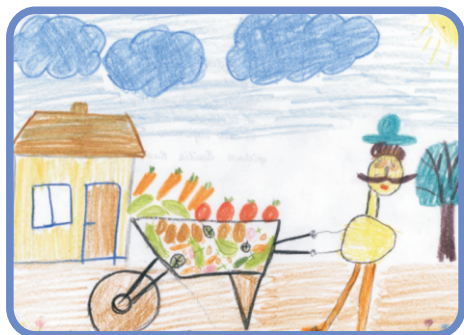
"W zdrowym ciele, zdrowy duch"