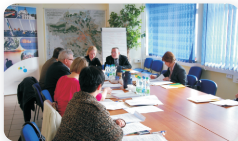
posiedzenie komisji ofertowej