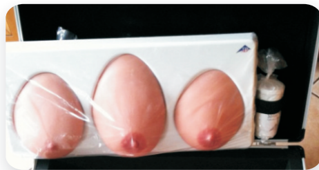
model do nauki badania piersi

Ponieważ edukacja prozdrowotna jest zadaniem lekarza pierwszego kontaktu, 30 czerwca 2008 roku w Szpitalu Bródnowskim w Warszawie, w ramach Programu zostało zorganizowane szkolenie dla lekarzy i pielęgniarek, które poprowadzili dietetycy. Trzydziestu dwóch uczestników szkolenia otrzymało ulotki dla pacjentów o tematyce edukacyjno – prozdrowotnej.