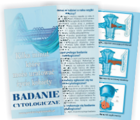
ulotki informacyjne (2006-2008)