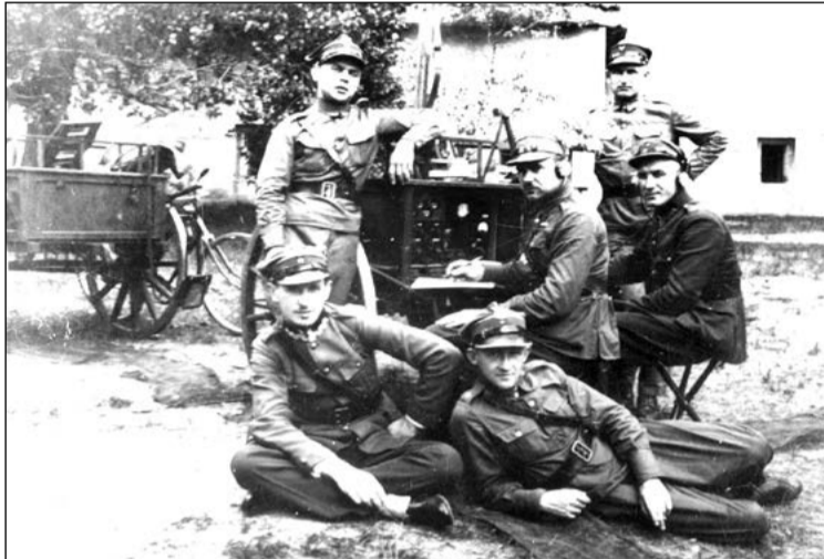
Obsługa radiostacji RKD, Zegrze lata 20.

Wojska niemieckie weszły do garnizonu w sierpniu 1915 r. Walki toczyły się o fort w Dębem, natomiast Zegrze i Białobrzegi zajęto praktycznie bez walki. Przez kolejne trzy lata koszary były ośrodkiem szkolenia uzupełnień dla frontu wschodniego, a potem