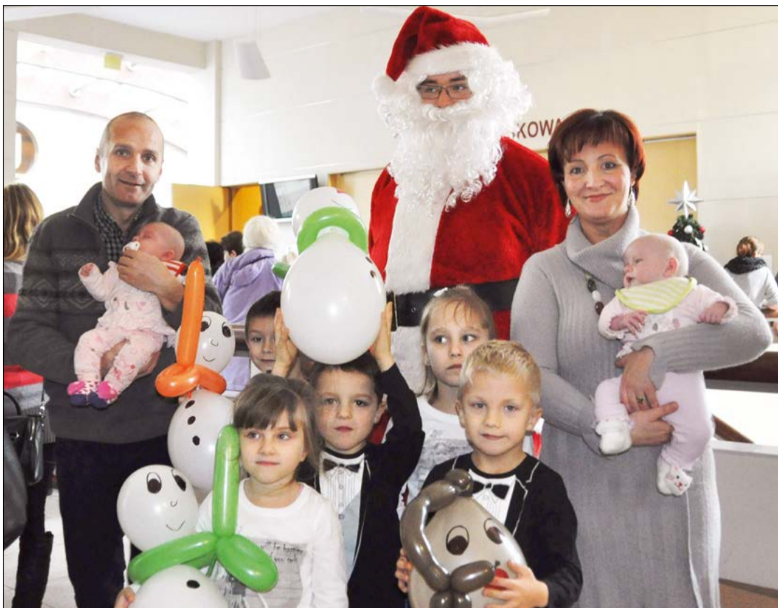
Państwo Czapscy doceniają możliwość spotkania się z innymi rodzinami zastępczymi