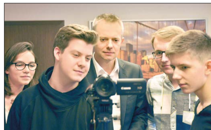
Państwo Czapscy doceniają możliwość spotkania się z innymi rodzinami zastępczymi