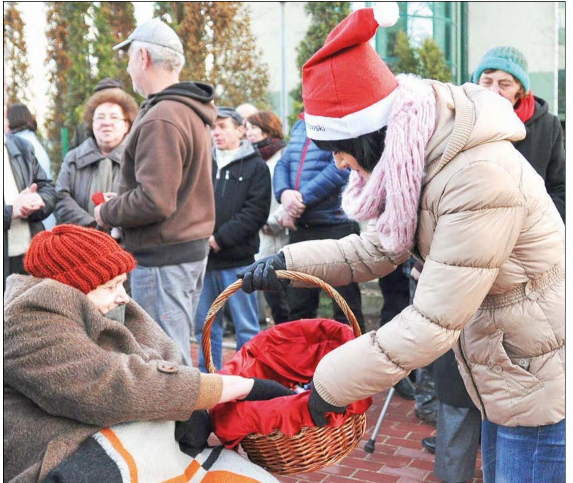
Otwarcie nowej drogi miało mikołajkowe akcenty. Pomocnicy Świętego Mikołaja obdarowywali mieszkańców pierniczkami i mikołajowymi czapkami