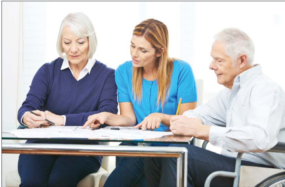
Z bezpłatnych porad mogą skorzystać m.in. kombatanci, weterani oraz osoby powyżej 65 roku życia

Katalog osób uprawnionych do skorzystania z nieodpłatnych porad prawnych jest ograniczony. Nie skorzysta więc z tej formy przedsięwzięcia, który chce zasięgnąć opinii w sprawach podatkowych, z zakresu prawa celnego, dewizowego czy handlowego. Porady dotyczące prowadzenia działalności gospodarczej będą dostępne wyłącznie dla osób, które przygotowują się do jej rozpoczęcia. Drzwi punktów porad będą natomiast otwarte dla osób korzystających ze świadczeń pomocy społecznej, rodzin objętych Kartą Dużej Rodziny, kombatantów, weteranów,