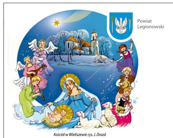
Kościół w Wieliszewie rys. J. Drozd

Często przechodzę obok liceum i z radością stwierdzam, że jest coraz piękniej i nowocześniej. Budowa boiska jest inwestycją, która dodatkowo wpłynie na atrakcyjność placówki wśród przyszłych uczniów, a obecnym poprawi warunki do uprawiania sportów. Jestem jak najbardziej na TAK!