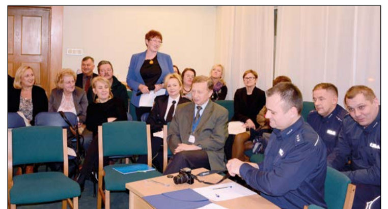
W dyskusji uczestniczyli zarówno mieszkańcy, jak i przedstawiciele policji, władz samorządowych, oświaty, sołtysi oraz radni