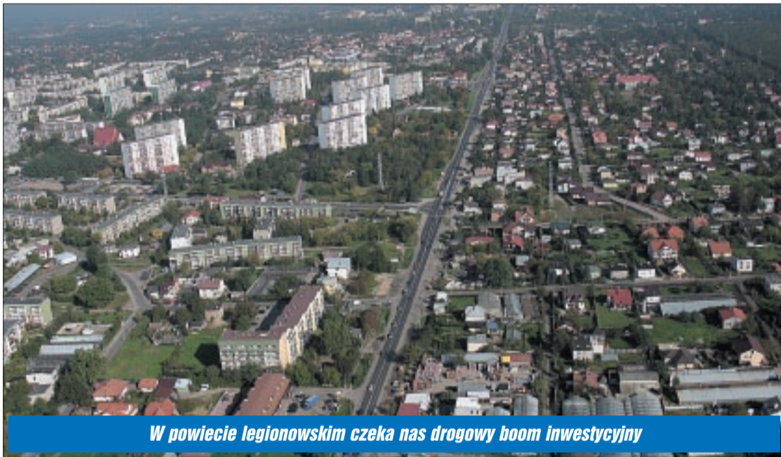
W powiecie legionowskim czeka nas drogowy boom inwestycyjny

Przebudowa legionowskiego wiaduktu, obwodnica Jabłonna, likwidacja „wąskiego gardła” przy granicy z Warszawą, wreszcie poszerzenie drogi 61 przez Legionowo – to najważniejsze inwestycje, jakie czekają nas w najbliższym czasie.