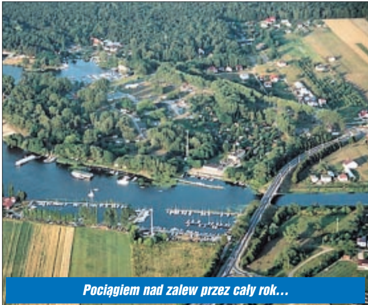
Pociągiem nad zalew przez cały rok...

Istnieje duża szansa, że już od września uruchomione zostanie całoroczne połączenie kolejowe Legionowo – Nieporęt – Legionowo. Aby zapewnić dogodne przesiadki, kursy szynobusu Zegrzyk będą zgrane z pociągami z Warszawy.