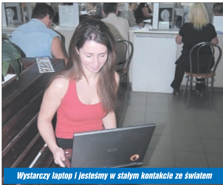
Wystarczy laptop i jesteśmy w stałym kontakcie ze światem

W środowy wieczór, 23 maja, w auli Starostwa wystąpił Artur Andrus. Przez blisko półtorej godziny artysta zapewnił zebranym doskonałą śmiechoterapię. Ludowe klimaty, piosenka żołnierska, absurdy codziennego życia i polityka oraz duża dawka autoironii – przedsta-