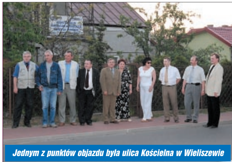
Jednym z punktów objazdu była ulica Kościelna w Wieliszewie

Radni powiatu legionowskiego nie ograniczają się do posiedzeń w starostwie. Zdarza się im również odbywać komisje wędrowne.