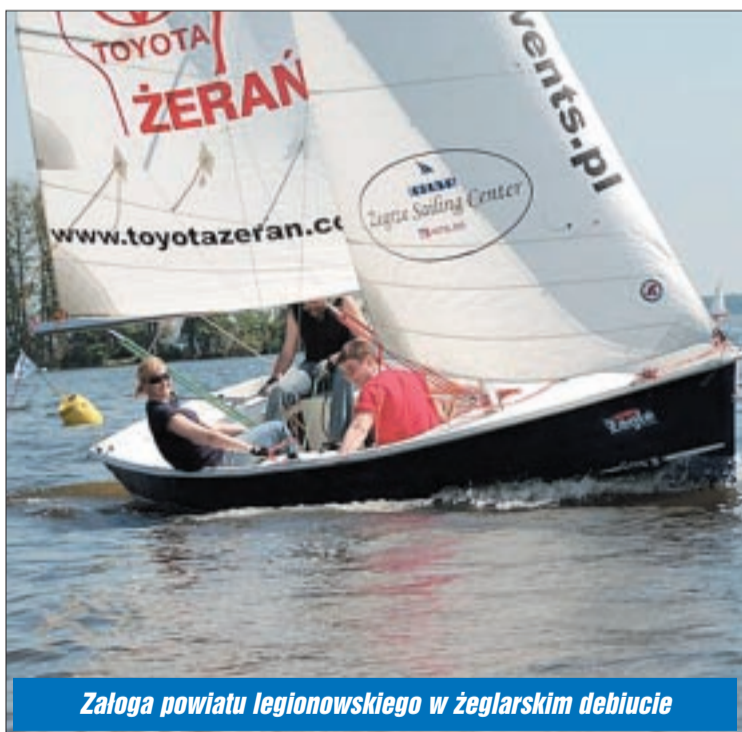
Załoga powiatu legionowskiego w żeglarskim debiucie

Po raz pierwszy w historii Powiat Legionowski zorganizował Regaty o Puchar Starosty Legionowskiego. 19 maja, w sobotnie popołudnie, najlepszymi żeglarzami okazali się zawodowcy z Legionowa.