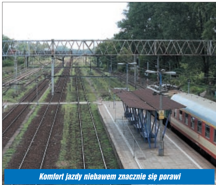
Komfort jazdy niebawem znacznie się porawi

Modernizacja trasy Legionowo-Warszawa to jeden z pierwszych, bardzo długo oczekiwanych etapów przebudowy linii kolejowej ze stolicy do Trójmiasta. Pieniądze z Unii Europejskiej oczekiwały na zainwestowanie już od kilku lat. Na szczęście Polska otrzymała prawo organizacji EURO 2012, a szybka i „bezbolesna” podróż koleją pomiędzy miastami-organizatorami piłkarskich mistrzostw to jeden z wymogów UEFA. Na imprezie skorzystają także mieszkańcy powiatu legionowskiego, którzy szybciej i bez korków dojadą do stolicy. ■