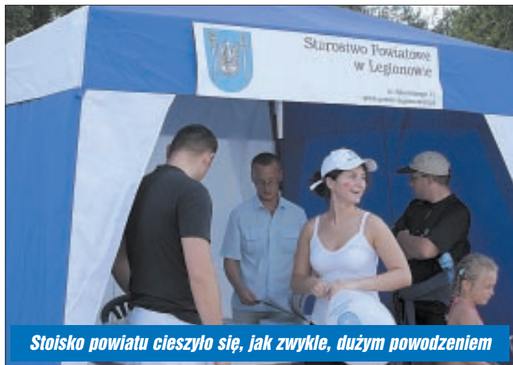
Stoisko powiatu cieszyło się, jak zwykle, dużym powodzeniem

nikom towarzyszyli śpiewający korsarze. Koleją można było przejechać bezpłatnie do stacji w Wieliszewie, skąd na plażę odjeżdżały bezpłatne autobusy. Pirackie bilety rozdawało radio