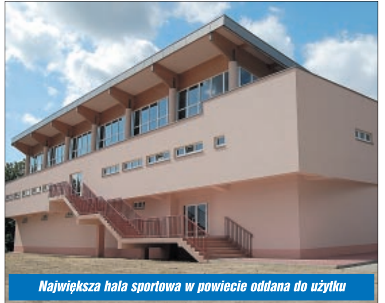
Największa hala sportowa w powiecie oddana do użytku

Największa inwestycja w dotychczasowej historii Powiatu Legionowskiego dobiegła końca. Hala sportowa w Serocku łąda moment znacznie służyć młodym zawodnikom.