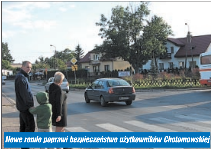
Nowe rondo poprawi bezpieczeństwo użytkowników Chotomowskiej

Inwestycje to absolutny priorytet, niestety potrzeby w tym zakresie zdecydowanie przewyższają możliwości finansowe Powiatu Legionowskiego. Jest jednak na to rada: dofinansowanie z zewnątrz!