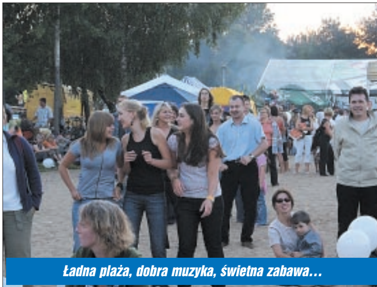
Ładna plaża, dobra muzyka, świetna zabawa...

Złote Przeboje, tawerna Gniazdo Piratów, portal szantymaniak.pl , Koleje Mazowieckie, starostwo powiatowe i urząd gminy.