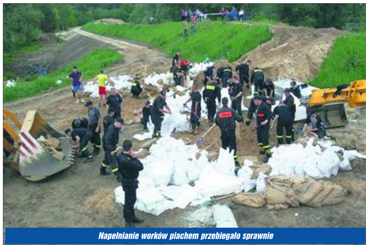
Napełnianie worków piachem przebiegało sprawnie