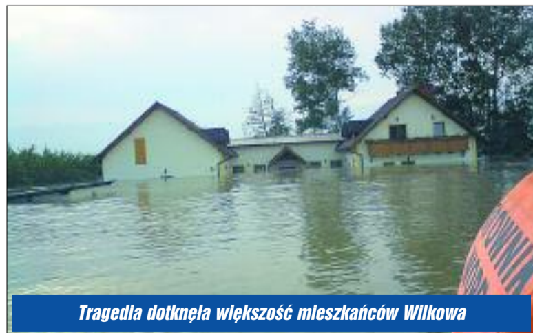
Tragedia dotknęła większość mieszkańców Wilkowa

Obroniliśmy powiat legionowski przed powodzią, ale są takie miejsca w kraju, gdzie wielu ludzi zostało pozbawionych dorobku całego życia. Takim miejscem jest Gmina Wilków w województwie lubelskim, woda zalała prawie 90% jej powierzchni.