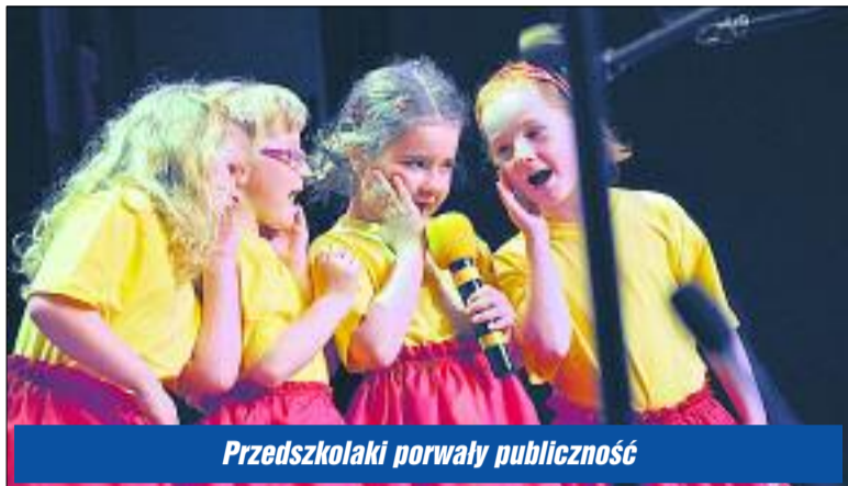
Przedkolaki porwały publiczność

Dzieciom z przedszkoli i podstawówek z powiatu legionowskiego czwartkowy poranek (13.05) upłynął pod znakiem zdrowia. W tym roku konkurs „Zdrowie w bajce” przeniół się na deski sali widowiskowej legionowskiego ratusza.