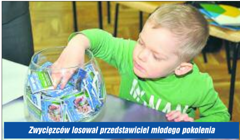
Zwycięzców losował przedstawiciel młodego pokolenia

Są już wśród nas pierwsi szczęśliwcy, którzy zdecydowali się wziąć udział w konkursach akcji „100 000 mieszkańiec powiatu legionowskiego”. Być może ich przykład zachęci kolejne osoby, aby dołączyć do społeczności powiatu, wygrywając przy okazji atrakcyjne nagrody.