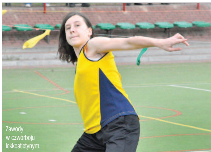
Zawody w czwórboju lekkoatletycznym.

Igrzyska są realizowane na terenie Powiatu Legionowskiego od 2000 roku. Startuje w nich około 5000 uczniów ze wszystkich typów szkół. Tak ogromna rzesza osób, które są bezpośrednio zaangażowane w starty, czyni Mazowieckie Igrzyska najbardziej powszechną formą aktywności fizycznej dzieci i młodzieży. Zachęcamy do odwiedzania strony powiat-legionowski.pl, gdzie na bieżąco będziecie mogli Państwo śledzić wyniki poszczególnych imprez. MD