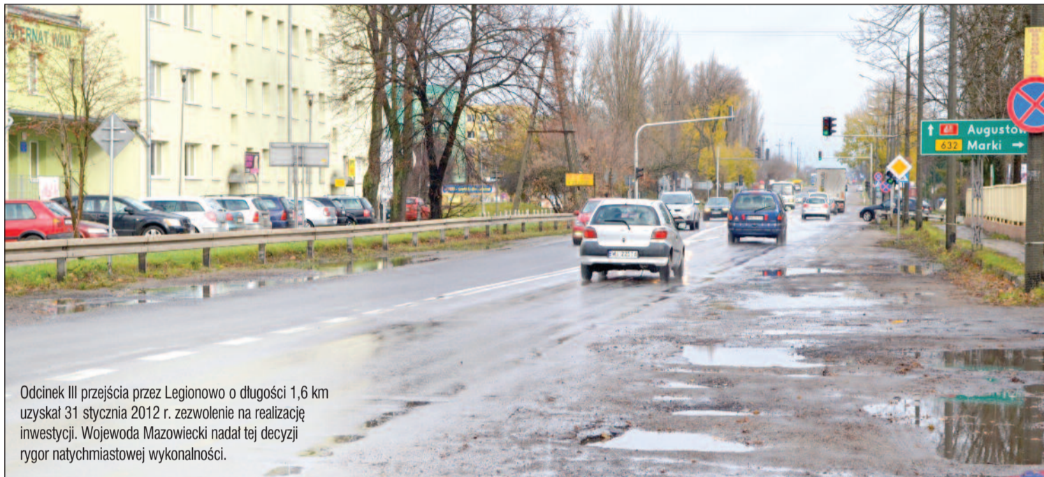
Odcinek III przejścia przez Legionowo o długości 1,6 km uzyskał 31 stycznia 2012 r. zezwolenie na realizację inwestycji. Wojewoda Mazowiecki nadał tej decyzji rygor natychmiastowej wykonalności.