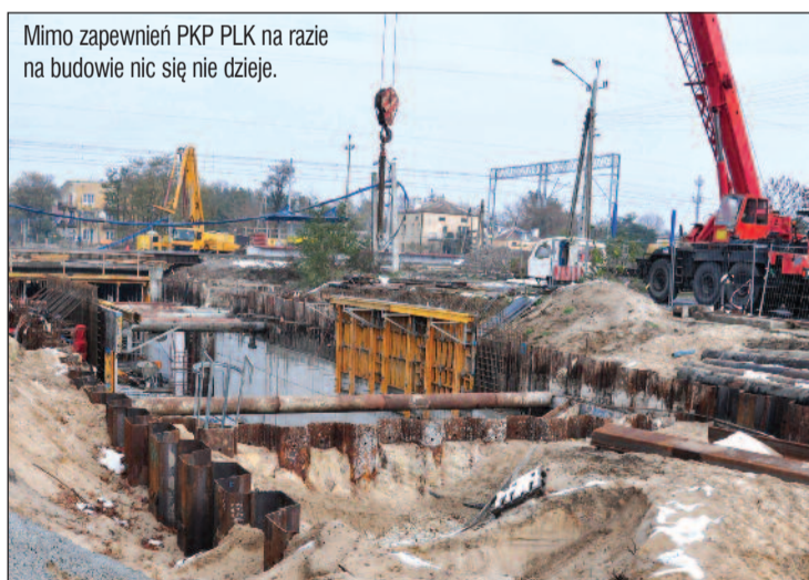
Mimo zapewnień PKP PLK na razie na budowie nic się nie dzieje.

Budowa tunelu, który ma usprawnić komunikację pomiędzy dwoma częściami miasta przeciętego torami kolejowymi jest wyjątkowo pechowa. Pierwsze opóźnienia w stosunku do planowanego terminu oddania przeprawy spowodowały wysokie wody gruntowe, które zalewały plac budowy. Teraz ewentualna upadłość wykonawcy robót może ponownie przesunąć w czasie ich zakończenie. „Budowa tunelu pod linią kolejową E65