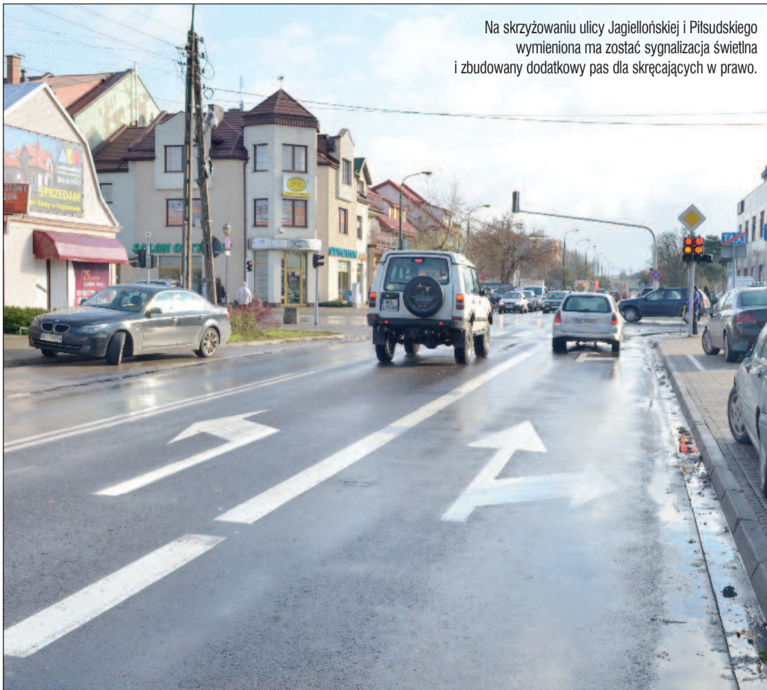
Na skrzyżowaniu ulicy Jagiellońskiej i Piłsudskiego wymieniona ma zostać sygnalizacja świetlna i zbudowany dodatkowy pas dla skręcających w prawo.