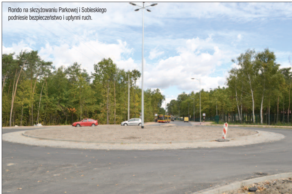
Rondo na skrzyżowaniu Parkowej i Sobieskiego podniesie bezpieczeństwo i upłynni ruch.

powiat, udało się wykonać dodatkowe odwodnienie tunelu i włączyć je do miejskiego systemu. Ma to zapobiec zalewaniu tunelu w przypadku szczególnie obfitych opadów deszczu. NAC