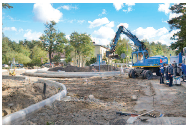
Prace są na tyle zaawansowane, że widać już kształt powstającego ronda.