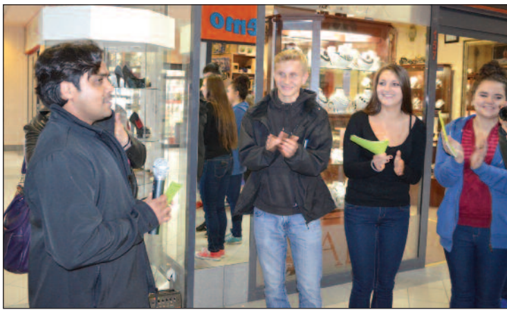
Dzięki akcji twórczość Tuwima poznawali również obcokrajowcy mieszkający w Legionowie.