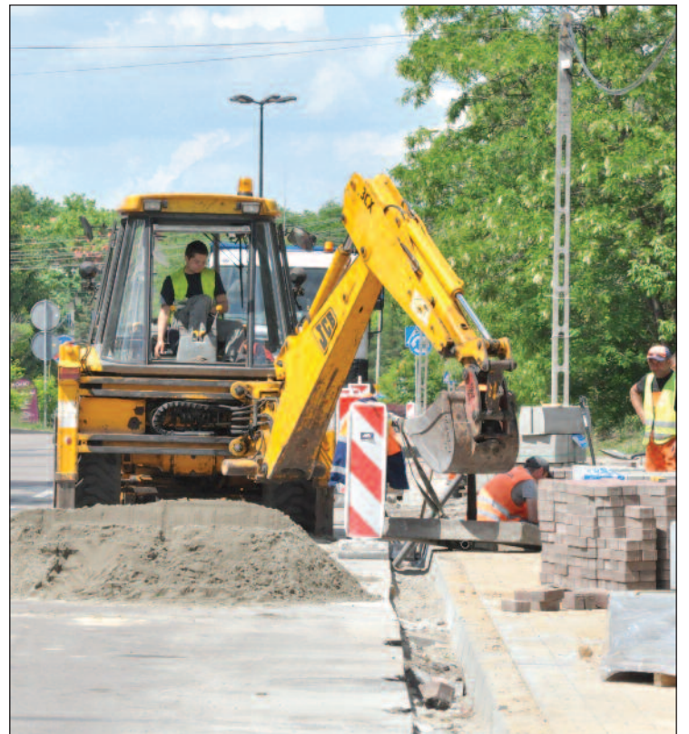
Za pieniądze przeznaczane na „janosikowe” można by wykonać wiele potrzebnych mieszkańcom inwestycji.

Zebrani u marszałka samorządowcy wymienili się pomysłami na zmiany legislacyjne i ustalili, że powołają zespół roboczy, który propozycje te opar-