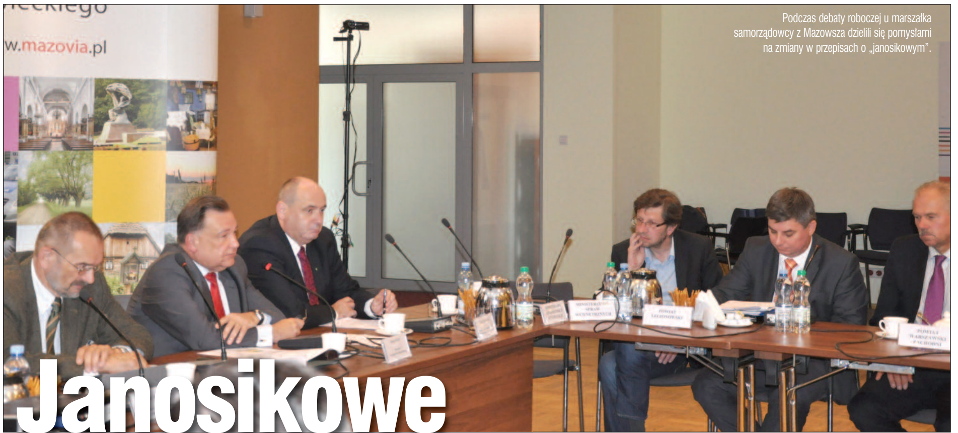
Podczas debaty roboczej u marszałka samorządowcy z Mazowsza dzielili się pomysłami na zmiany w przepisach o „janosikowym”.