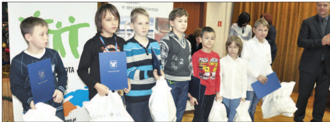
Laureaci III miejsca na Mazowszu w gimnastyce sportowej – drużyna ze Szkoły Podstawowej nr 2 w Legionowie

Przez cały rok szkolny wytrwale ćwiczyli i wygrywali. W listopadzie podczas sesji Rady Powiatu w Legionowie młodzi sportowcy ze szkół w powiecie legionowskim odebrali gratulacje, dyplomy i nagrody.