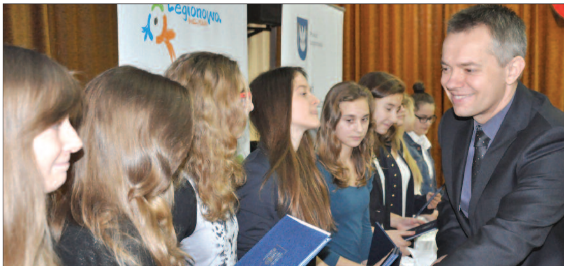
Nagrody mistrzyniom w biegach przelajowych ze Szkoły Podstawowej nr 7 w Legionowie wręczył wicestarosta Robert Wróbel