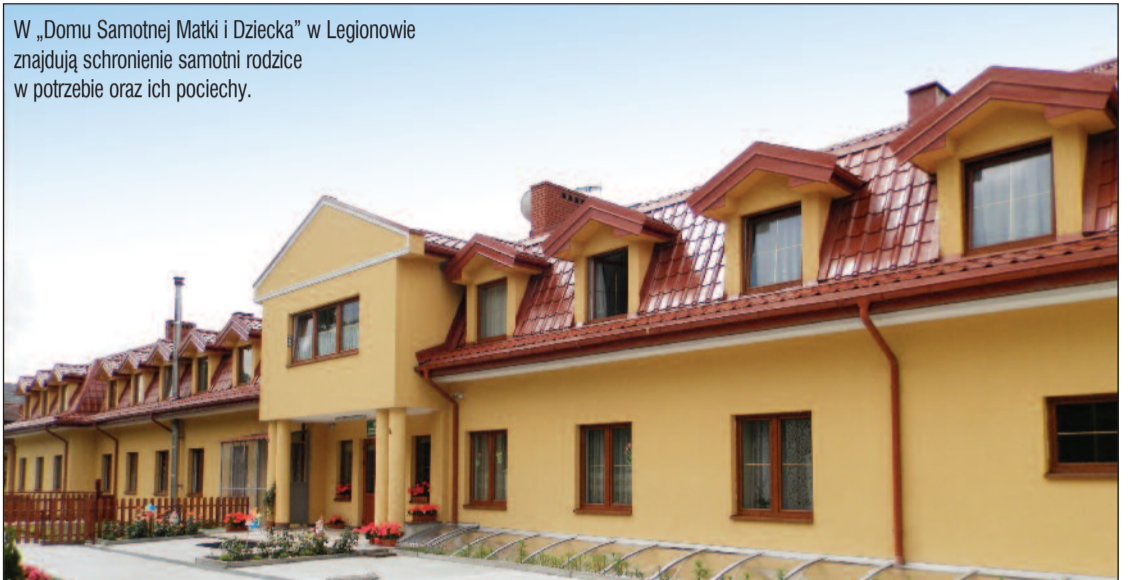
W „Domu Samotnej Matki i Dziecka” w Legionowie znajdują schronienie samotni rodzice w potrzebie oraz ich pociechy.