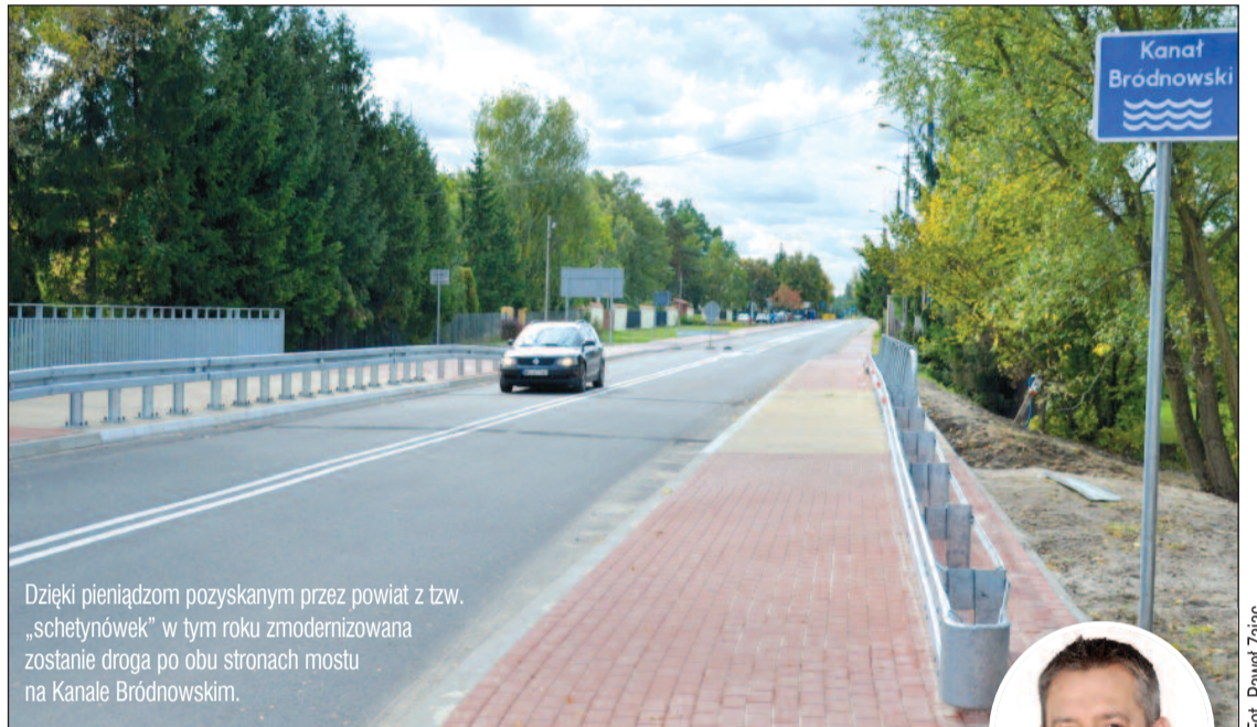
Dzięki pieniądзом pozyskanym przez powiat z tzw. „schetynówek” w tym roku zmodernizowana zostanie droga po obu stronach mostu na Kanale Bródnowskim.

Na takim obrocie sprawy skorzystają na pewno mieszkańcy Łajsk i Wieliszewa, przez które przebiega ulica Kościelna. To na dokończenie przebudowy tej drogi mają zostać przeznaczone środki z rządowego programu. Zakres inwestycji obejmuje dokończenie modernizacji tej drogi na odcinkach, które nie zostały jeszcze przebudowane. Zaplanowano tam szereg urządzeń, które wydatnie poprawią bezpieczeństwo uczestników