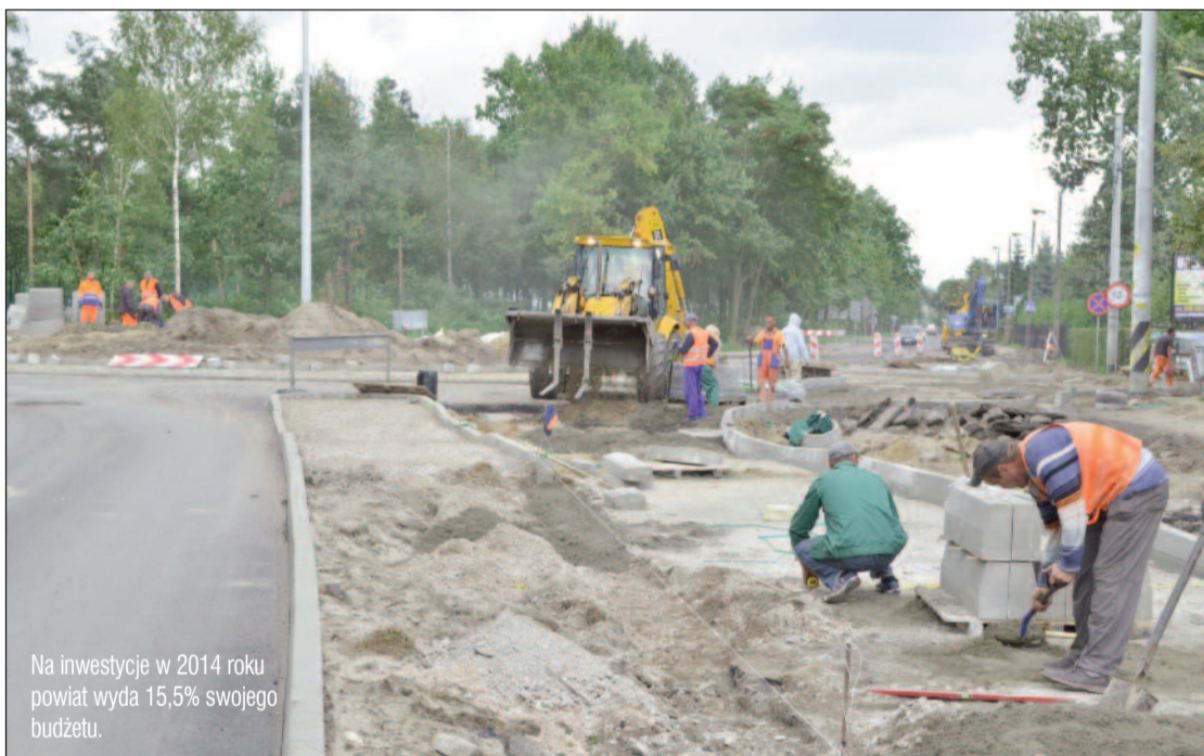
Na inwestycje w 2014 roku powiat wyda 15,5% swojego budżetu.

– Prace nad budżetem powiatu na 2014 rok rozpoczęliśmy już w sierpniu br., kiedy to Zarząd przyjął ogólne założenia uwzględniające sytuację finansową powiatu oraz prognozy wskaźników makroekonomicznych na kolejne lata. W oparciu o te założenia kierownicy jednostek organizacyjnych przygotowali propozycje planów finansowych swoich jednostek. Kolejny etap to prace Zarządu nad budżetem zwane potocznie „równoważeniem”, których celem było przede wszystkim znalezienie kompromisu pomiędzy nieograniczonymi potrzebami finansowymi przy ograniczonych ustawowo źródłach ich finansowania w postaci dochodów publicznych. Zapewnieniu środków na rozwój, w tym głównie realizację inwestycji, przy jednoczesnym zachowaniu bezpiecznego poziomu zadłużenia powiatu. Pomimo,