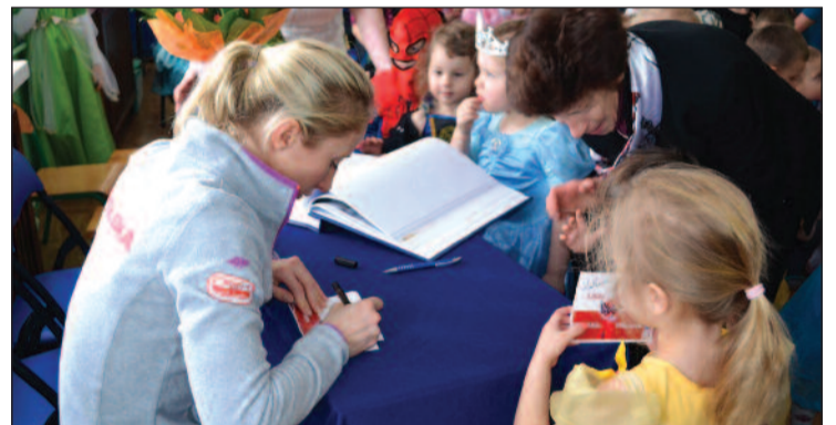
Luiza Złotkowska podarowała wszystkim kibicom z przedszkola i szkoły w Olszewnicy swoje fotografie z autografem.

Przedstawiciele samorządów lokalnych życzyli naszej panczeniste powodzenia. Na pożegnanie Luiza Złotkowska wpisała się do Księgi Pamiątkowej szkoły w Olszewnicy Starej i rozdała dzieciakom zdjęcia z autografem.