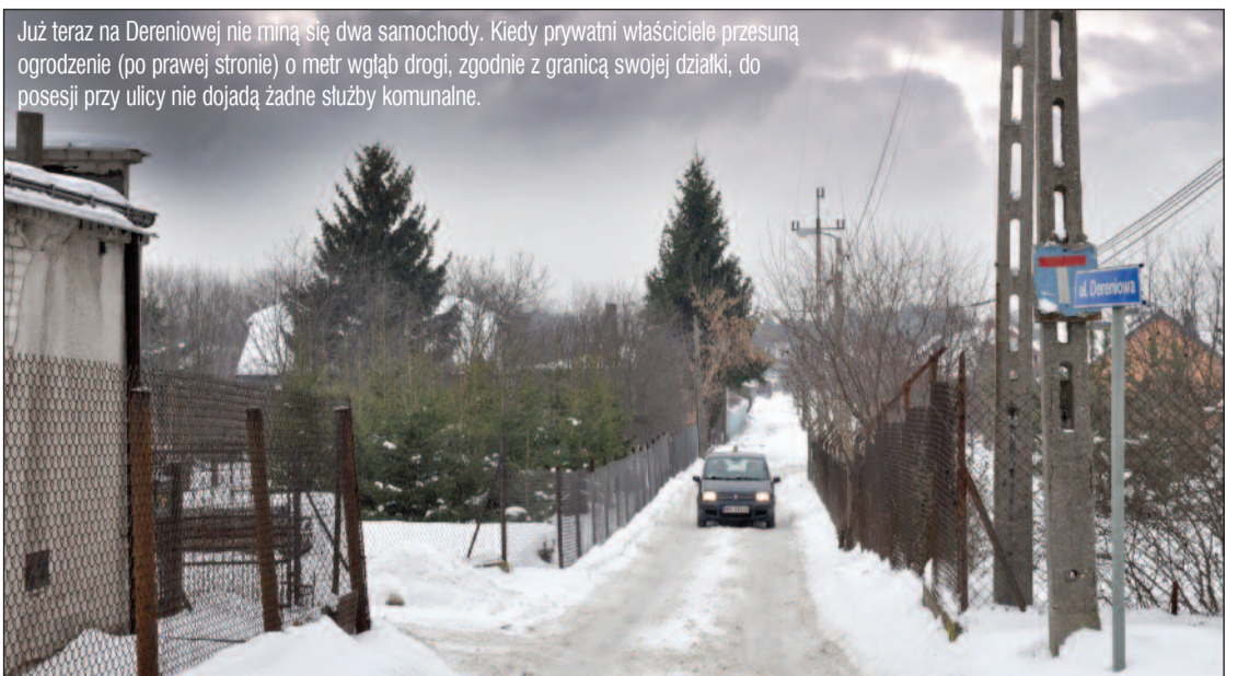
Już teraz na Dereniowej nie miną się dwa samochody. Kiedy prywatni właściciele przesuną ogrodzenie (po prawej stronie) o metr wgląd drogi, zgodnie z granicą swojej działki, do posesji przy ulicy nie dojadą żadne służby komunalne.

Połowicznie udało się tego dokonać. Jedną stronę drogi radni postanowili wykupić. Na sesji podjęliśmy odpowiednią uchwałę. Nie udało nam się jednak uzyskać odpowiedzi, dlaczego w tym samym czasie nie została wykupiona druga strona drogi, co załatwiło by sprawę. Mieszkańcy, którzy uczestniczyli w posiedzeniu Komisji Rozwoju w sierpniu 2013 dostali od pani wójt zapewnienie, że dalszym wykupem zajmie się we wrześniu.