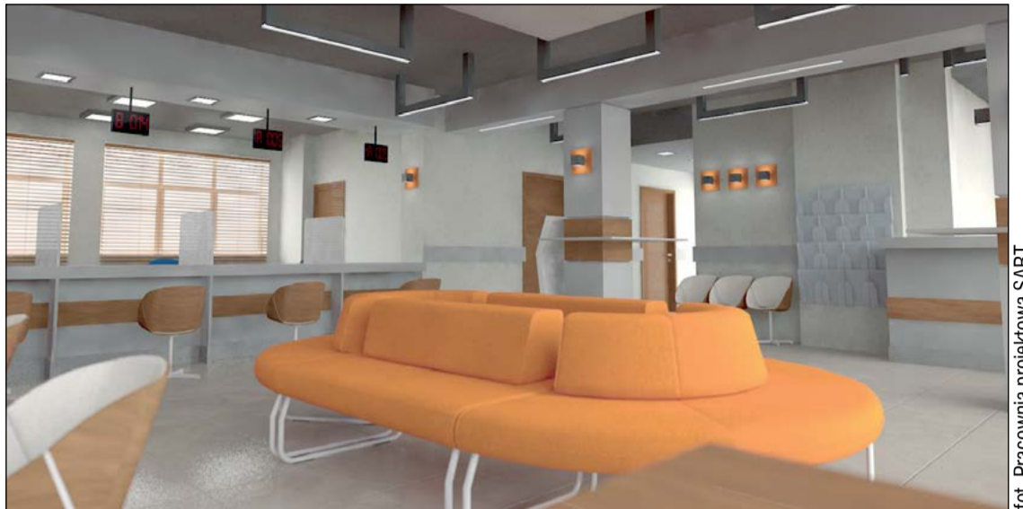
Tak będzie wyglądał wydział komunikacji po remoncie. Na czas robót obsługa klientów została przeniesiona do auli starostwa na parterze