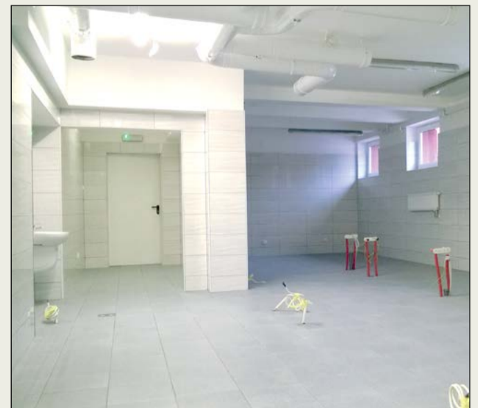
Zakończył się remont pomieszczeń. Teraz powiat zaopatrzy pracownię gastronomiczną w kompletne wyposażenie