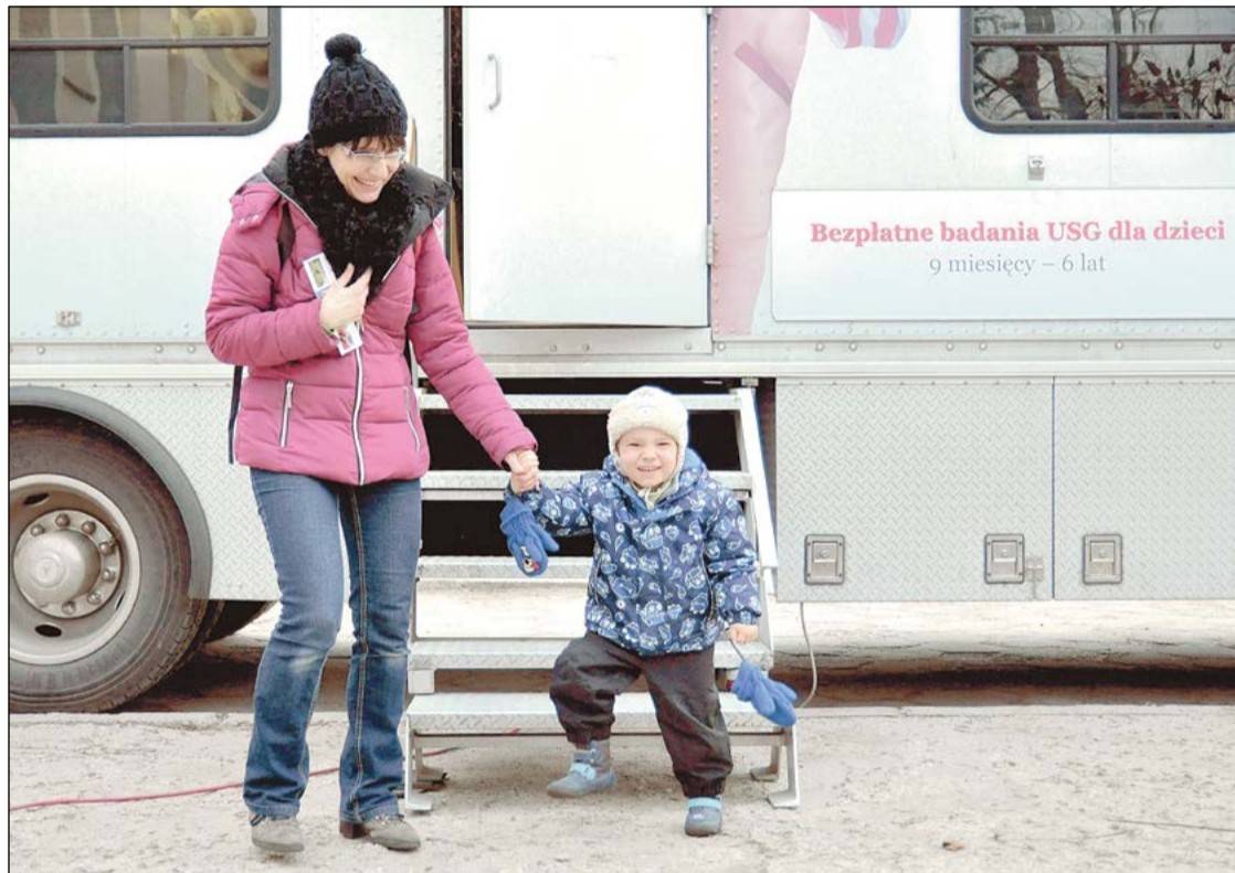
Badania profilaktyki nowotworowej dla dzieci powiat prowadził dwutorowo – w przygodni NZOZ „Legionowo” oraz w ambulansie Fundacji Ronalda McDonalda

Tegoroczna akcja bezpłatnych badań profilaktycznych dla mieszkańców powiatu cieszyła się ogromnym powodzeniem. Wolne miejsca rozeszły się jak świeże bułeczki. Czas na podsumowanie.