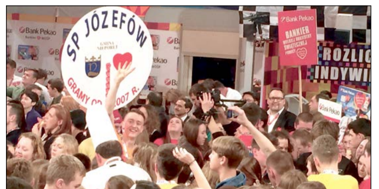
Ekip ze sztabów WOŚP z naszego powiatu nie mogło zabraknąć na wielkim finale w telewizji - byli tam również wolontariusze ze sztabu w SP w Józefowie

Organizatorzy przygotowali mnóstwo ciekawych atrakcji. Miłośnikom sportu emocji dostarczył turniej piłki siatkowej, w którym wystartowały reprezentacje Starostwa Powiatowego, Urzędu Miasta i Powiatowego Zespołu Szkół Ogólnokształcących. Triumfowali siatkarze starostwa. Ponadto przez cały dzień miały miejsce występy i pokazy artystyczne oraz licytacje, a hall budynku zapełnił