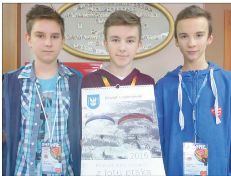
Sztab w PZO w Legionowie. W licytacjach można było zdobyć m.in. kalendarz na 2016 rok wydany przez powiat