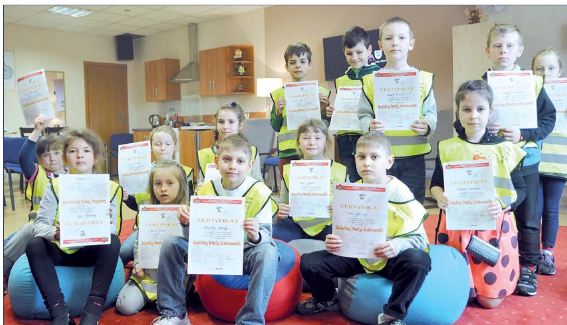
Sala „Iskierka” będzie służyć najmłodszym mieszkańcom powiatu. Będą się w niej uczyć, jak uniknąć niebezpieczeństwa i jak zachować się w kryzysowych sytuacjach. Powiat legionowski dofinansował jej utworzenie kwotą blisko 24 tysięcy złotych

W budynku Komendy Powiatowej Państwowej Straży Pożarnej w Legionowie powstała sala edukacyjna o wdzięcznej nazwie „Iskierka”, w której dzieci będą uczyły się zasad bezpieczeństwa i nawyków pozwalających je zachować.