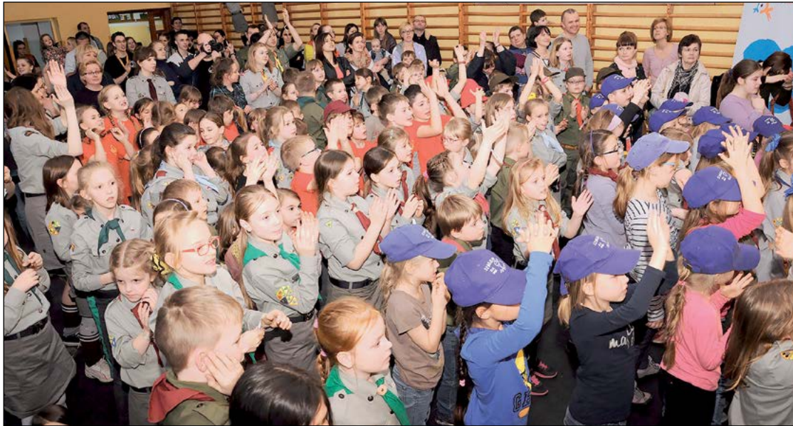
Harcerze, zuchy i miłośnicy piosenki harcerskiej z całej Polski bawili się wspólnie podczas siódmej już odsłony Festiwalu „Wiosenne Czarowanie”

W weekend 15-17 kwietnia w Legionowie już po raz siódmy odbył się Harcerski Festiwal Piosenki „Wiosenne Czarowanie”. Harcerze z całej Polski spotkali się w Zespole Szkół nr 1, by wspólnie czarować piosenką z hasłem „Wędruj z nami!”.