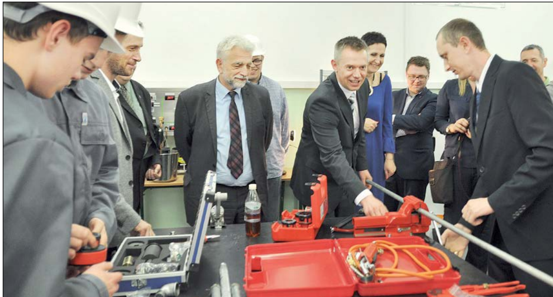
Uczniowie technikum w PZSP im. J. Siwińskiego w Legionowie, którzy kształcą się na techników urządzeń i systemów energetyki odnawialnej, mają nową pracownię przedmiotową za blisko 122 tysiące złotych. Podczas otwarcia samorządowcy sprawdzali wyposażenie pracowni