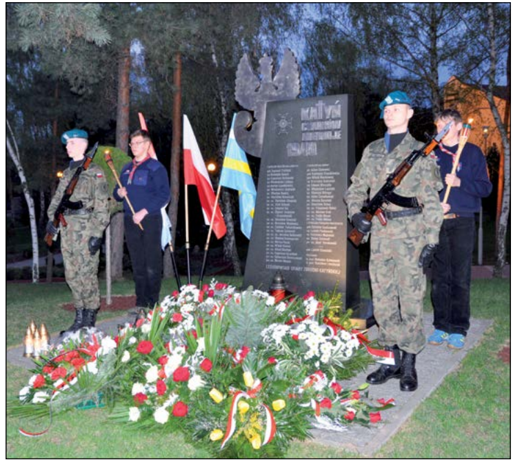
Pomnik Ofiar Zbrodni Katyńskiej w Legionowie (17.04.2016)

Pomnik ma formę symbolicznego pomnika nagrobnego z tablicą ofiar Zbrodni Katyńskiej, zwieńczoną orłem wojskowym. Na tablicy umieszczony jest napis Katyń-Charków-Miednoje-1940, znak krzyża Orderu Wojennego Virtuti Militari i wykaz 46 nazwisk legionowskich ofiar Zbrodni Katyńskiej. Wzniesiony w przestrzeni publicznej kościoła parafii pod wezwaniem Matki Boskiej Fatimskiej przy ul. Orłąt Lwowskich 8 jest dostępny dla wszystkich, którzy zechcą przy nim przeżyć chwile refleksji nad losem legionowskich ofiar Zbrodni Katyńskiej, nad dołą wszystkich ofiar Zbrodni Katyńskiej oraz ich rodzin, nad prawdą, pamięcią i przebaczeniem.