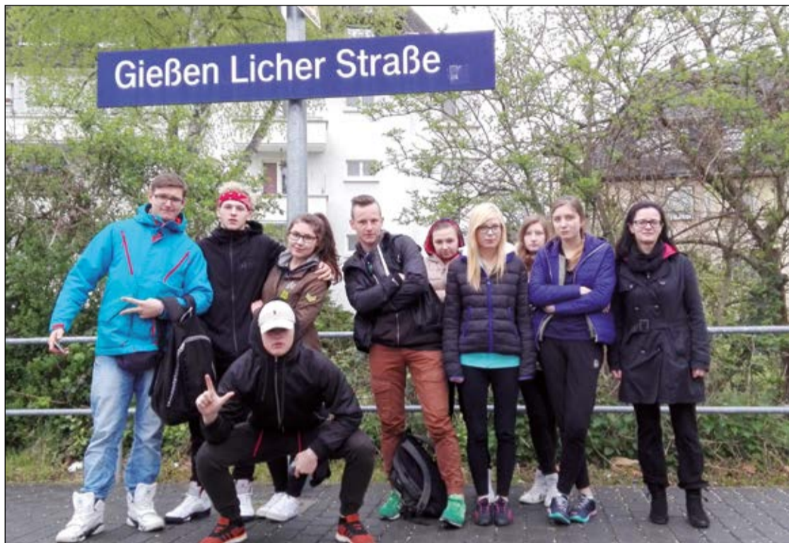
Wyjazd do Niemiec był dla uczniów z Serocka wyjątkową lekcją historii i otwartości na inne kultury oraz niezwykle atrakcją turystyczną

Grupa uczniów z Powiatowego Zespołu Szkół Ponadgimnazjalnych w Serocku przez tydzień gościła w niemieckim mieście Wetzlar na zaproszenie tamtejszej szkoły Theodor-Heuss-Schule. Wyjazd zorganizowano w ramach trójstronnego projektu realizowanego za pośrednictwem „Polsko-Niemieckiej Współpracy Młodzieży” oraz „Czesko-Niemieckiej Współpracy Młodzieży Tandem”.