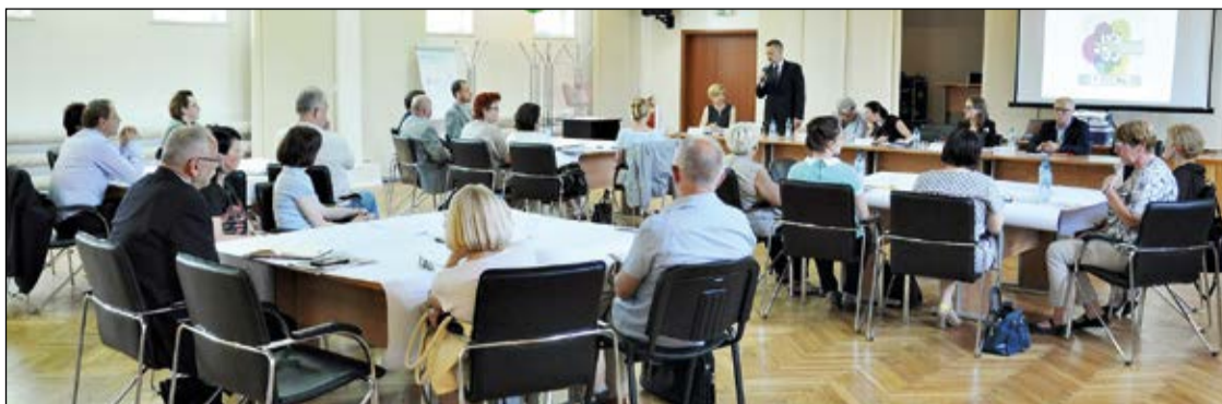
Podczas pierwszej konferencji międzysektorowego partnerstwa przekonywano, że zatrudnienie wspierane jest skuteczną formą walki z bezrobociem

29 czerwca odbyło się pierwsze spotkanie instytucji tworzących międzysektorowe partnerstwo. Uczestnikami byli też pracodawcy. Zaprezentowano na nim przykłady współpracy w obszarze zatrudnienia wspieranego i pokazano, jak