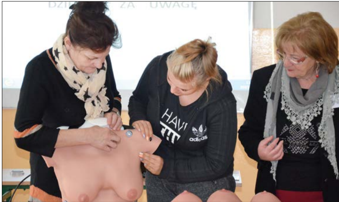
Profilaktyka przeciwnowotworowa w ramach programu „Zdrowy powiat” to nie tylko badania lekarskie, lecz także szkolenia z zakresu samobadania piersi dla uczennic ostatnich klas gimnazjów i szkół średnich

Zapraszamy mieszkańców do zapoznania się z ofertą przygotowaną w ramach 6. edycji Powiatowego Programu Polityki Zdrowotnej „Zdrowy Powiat” na 2016 rok.