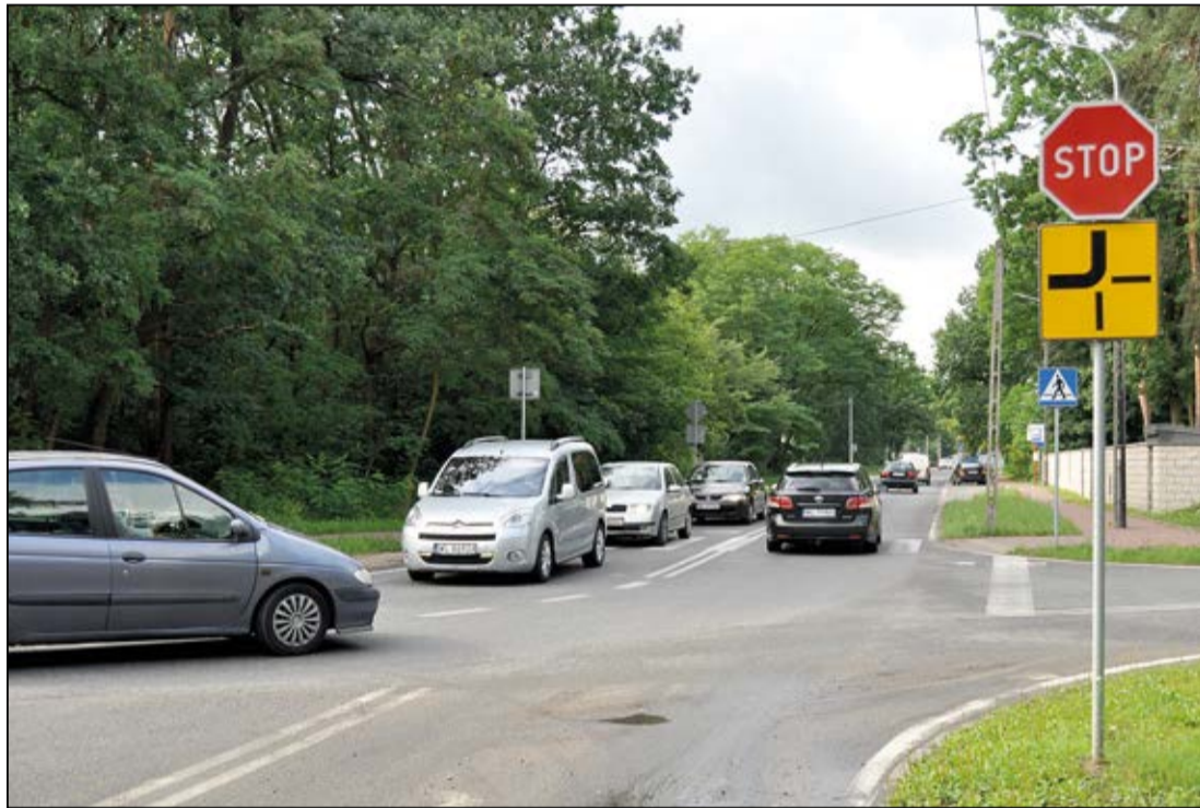
Na skrzyżowaniu Alei Róż i Alei Legionów będzie bezpiecznie

Powiat i miasto Legionowo w miejscu skrzyżowania Alei Róż z Aleją Legionów wybudują rondo, które usprawni organizację ruchu drogowego w okolicach tunelu.