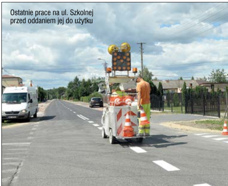
Ostatnie prace na ul. Szkolnej przed oddaniem jej do użytku

– zostały wykonane 20 lipca br. W momencie oddania tego numeru Kuriera do druku inspektorzy ze legionowskiego starostwa zakończyli już odbiór inwestycji, czyli sprawdzenie, czy wykonawca