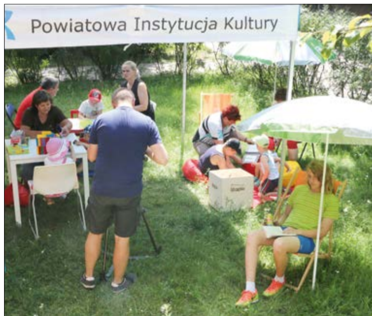
Z Letniej Strefy Gier korzystają całe rodziny

Przez cały lipiec i sierpień Powiatowa Instytucja Kultury w Legionowie zaprasza dzieci i młodzież do „Letniej Strefy Gier”.