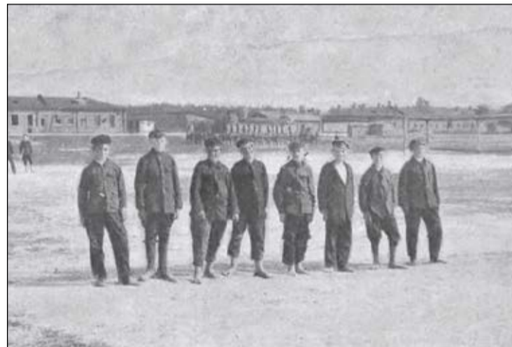
Szkolenie młodych ochotników w koszarach w Jabłonce (Legionowo) w przededniu Bitwy Warszawskiej („Tygodnik Ilustrowany” z 31 lipca 1920 r.)