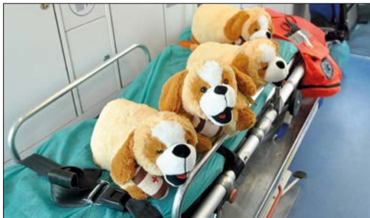
Pluszowe maskotki w karetkach uspokajają dzieci ułatwiając pracę ratownikom

Już po raz drugi Starostwo Powiatowe przekazało Ratownictwu Medycznemu w Legionowie pluszowe maskotki. Zabawki znalazły się na wyposażeniu karettek i zmniejszają stres u najmłodszych pacjentów przewożonych do szpitala.