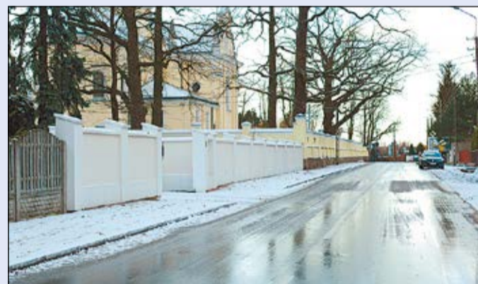
Wykonawca przebudowy drogi zdążył zakończyć prace przed załamaniem pogody

Droga powiatowa 1803W jest już przebudowana. Inwestycję zrealizował Powiat przy wsparciu finansowym miasta i gminy Serock.