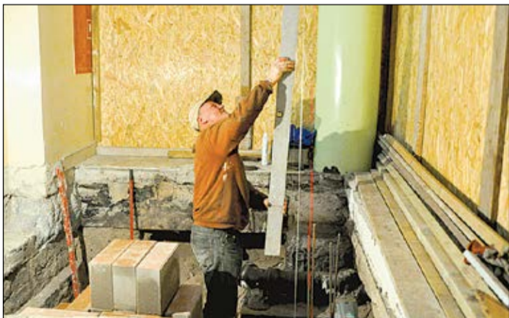
W dniu wydania „Kuriera” prace są prowadzone na 1. poziomie budynku szkoły

Powiatowy Zespół Szkół Ogólnokształcących w Legionowie będzie miał windę dostosowaną do potrzeb osób niepełnosprawnych. Dźwig obsłuży 5 poziomów budynku.