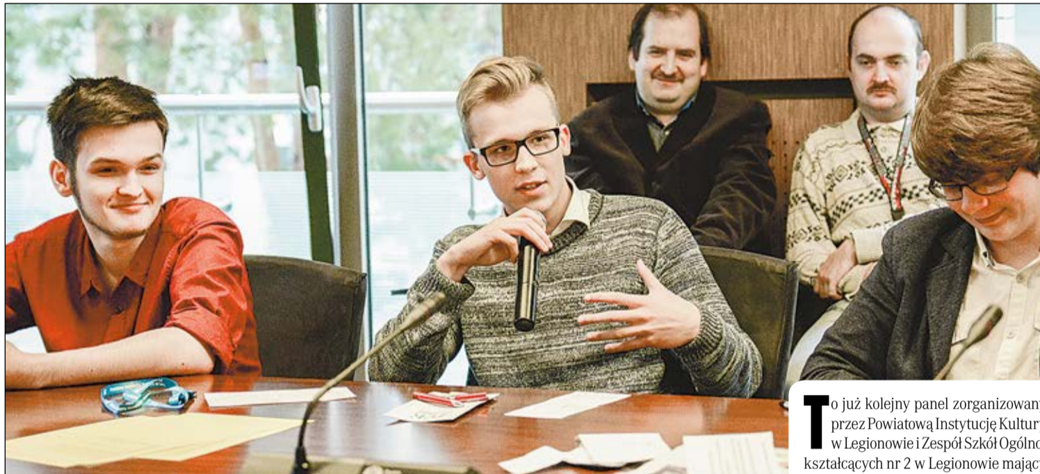
Uczniowie wspólnie zastanawiali się, jakie są granice demokracji, co jej sprzyja, a co zagraża

O zaletach i wadach demokracji dyskutowali uczniowie szkół gimnazjalnych i ponadgimnazjalnych z terenu powiatu legionowskiego, przedstawiciele Młodzieżowej Rady Miasta Legionowo oraz gazety międzyszkolnej „Młody Lider” w ramach debaty „O demokracji”.