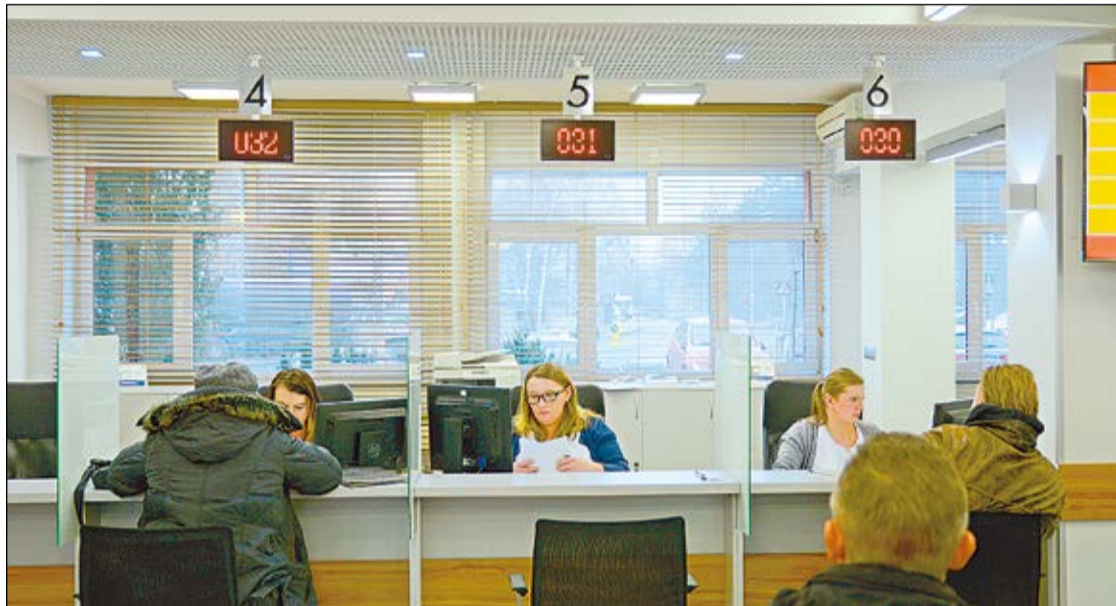
Cały parter starostwa dostosuje się technologicznie i estetycznie do nowoczesnego wydziału komunikacji

Już na początku 2017 r. rozpocznie się remont parteru starostwa powiatowego w Legionowie. Prace potrwać 110 dni. Dzięki przebudowie zmieni się organizacja obsługi mieszkańców, którym załatwienie formalności będzie zajmowało znacznie mniej czasu.