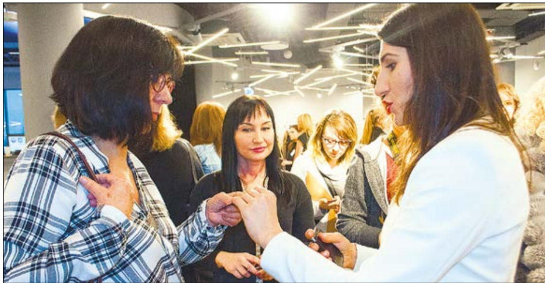
Sesja networkingowa w trakcie szkolenia była dla Pań doskonałą okazją do dyskusji i nawiązania kontaktów biznesowych, które być może zaowocują w przyszłości wspólnymi przedsięwzięciami

Zasady autoprezentacji, biznesowego dress-code'u i makijażu oraz biznesowy coaching to tylko niektóre z zagadnień uwzględnionych w programie bezpłatnego szkolenia „Kobieta w biznesie”, które odbyło się 19 listopada w Legionowie. Uczestniczyło w nim blisko 100 pań z terenu powiatu.