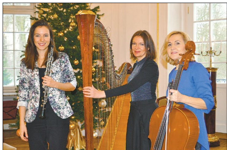
Trio muzyczne zaprezentowało, w mistrzowskiej aranżacji, utwory najświeższych kompozytorów

Utwory kilkunastu znakomitych kompozytorów znalazły się w programie styczniowego koncertu z cyklu „Pałacowe spotkania z muzyką”. Zwieńczeniem kulturalnej uczyły był wernisaż wystawy prac Artura Winiarskiego w Galerii Sztuki Współczesnej „Oranżeria”.