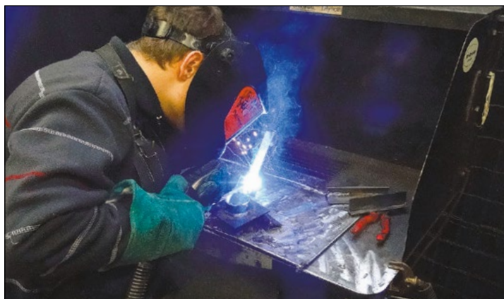
Specjalistyczne kursy podniosą kwalifikacje zawodowe uczniów PZSP w Legionowie

W listopadzie 2016 r. rozpoczęła się realizacja pierwszych kursów specjalistycznych. Dziesięcioosobowa grupa uczniów wzięła udział w szkoleniu pt. „Spawanie metodą TIG (141) i MAG (135) blach i rur ze stali ferrytycznych spoinami pachwinowymi”. Zajęcia teoretyczne zostały już przeprowadzone, obecnie trwają warsztaty praktyczne, które w lutym zakończą się egzaminem. Od marca kolejna grupa uczniów rozpocznie kurs. Z kolei w grudniu 2016 r.