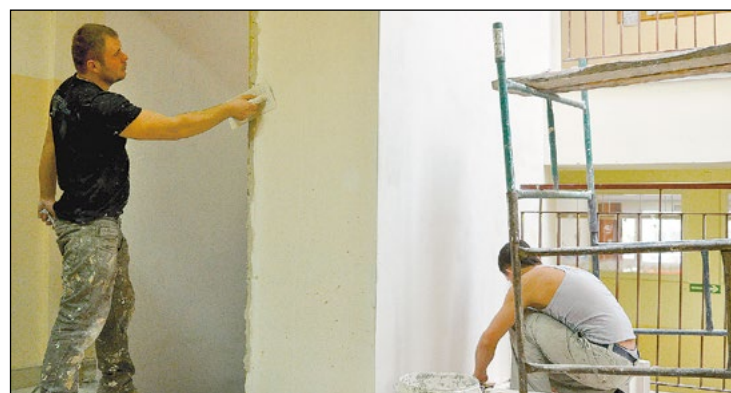
Przed instalacją kabiny windy pracownicy przygotowują wnęki jej szybu

Kończy się budowa windy, która będzie służyła uczniom Powiatowego Zespołu Szkół Ogólnokształcących w Legionowie. Pierwsi pasażerowie skorzystają z niej już po feriach zimowych.