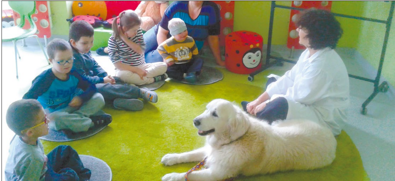
Mery, pies rasy golden retriever, uczestniczy w zajęciach z przedszkolakami. Kontakt ze zwierzęciem stymuluje rozwój dzieci i pozytywnie wpływa na ich samopoczucie

Od września br. rozpoczęła się realizacja dodatkowych zajęć specjalistycznych skierowanych do 16 dzieci uczęszczających do Przedszkola Specjalnego w Powiatowym Zespole Szkół i Placówek Specjalnych w Legionowie. Na ten cel Starostwo Powiatowe i szkoła pozyskali ponad 400 000 zł dofinansowania z Europejskiego Funduszu Społecznego.