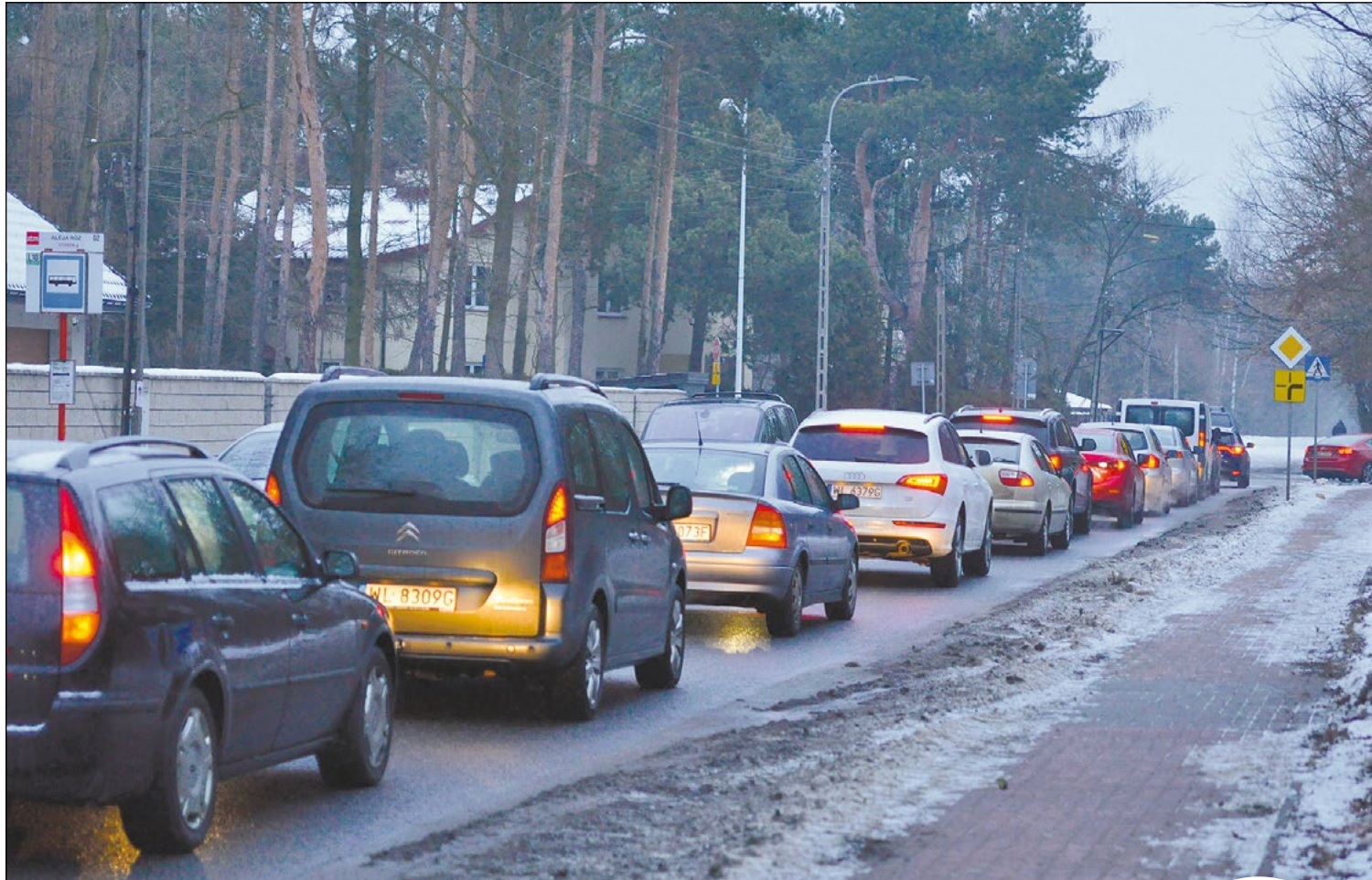
W dni robocze, rano, na skrzyżowaniu Alei Róż i Alei Legionów tworzy się korek, którego koniec czasami sięga poza tunel

Powiat wybuduje w 2017 roku rondo u zbiegu Alei Róż i Alei Legionów w Legionowie. To rozwiązanie zapewni większą płynność i bezpieczeństwo ruchu.