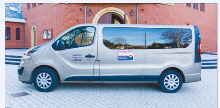
Nowy samochód dla Warsztatów Terapii Zajęciowej św. Rity spełnia wszystkie wymogi bezpieczeństwa i jest funkcjonalny