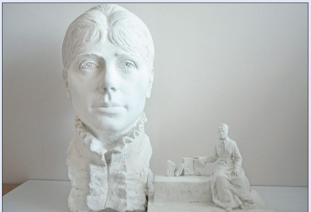
Zwycięski projekt charakteryzują prostota i dbałość o detale. Zdaniem komisji konkursowej właśnie ta propozycja najlepiej wpisuje się w krajobraz przy PZSO w Legionowie