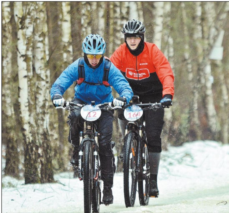
Zawodnicy uprawiający kolarstwo przełajowe lubią wyzwania. Jednym z nich mogą być trudne warunki atmosferyczne