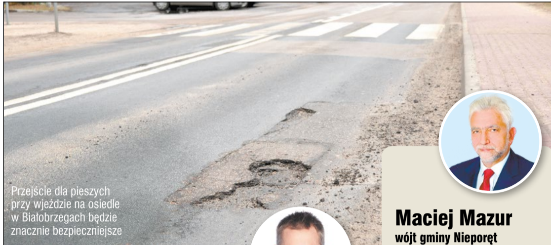
Przejście dla pieszych przy wjeździe na osiedle w Białobrzegach będzie znacznie bezpieczniejsze

Powiat Legionowski ogłosił przetarg na przebudowę drogi nr 4303W na odcinku od ronda w Białobrzegach do granicy powiatu w Beniaminowie. Inwestycja znajduje się na terenie gminy Nieporęt. Długość przewidzianego do remontu odcinka wynosi prawie 4,5 km.