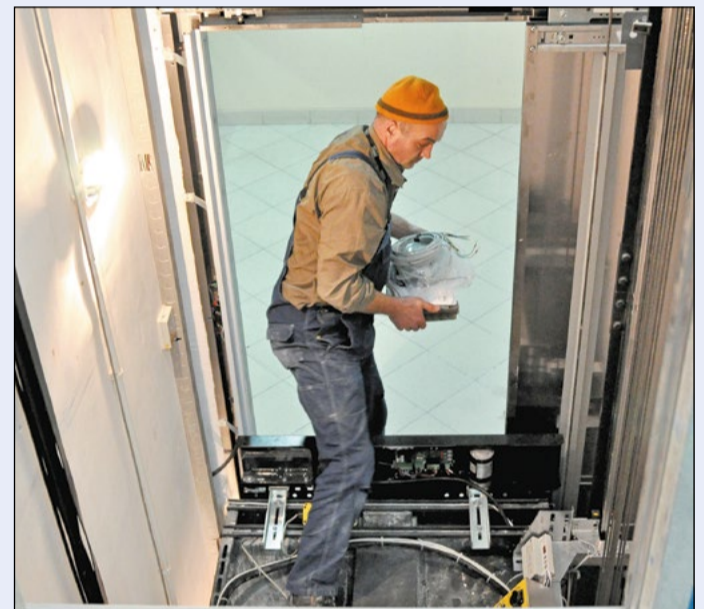
Po zamontowaniu kabiny windy należało wyregulować aparaturę elektryczną odpowiedzialną za bezawaryjne funkcjonowanie całego urządzenia

Zgodnie z harmonogramem prac została już zamontowana winda w Powiatowym Zespole Szkół Ogólnokształcących w Legionowie. Urządzenie jest przeznaczone do obsługi 5 poziomów budynku szkoły.