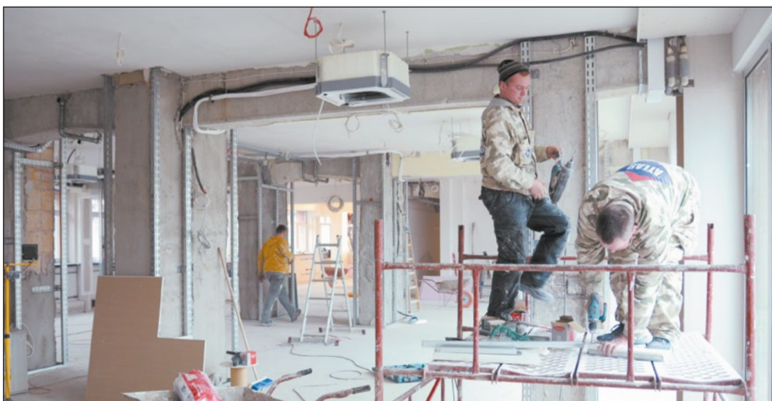
Wyburzenie części ścian na parterze oraz zamontowanie dużych okien sprawiło, że otwarta przestrzeń jest dużo jaśniejsza