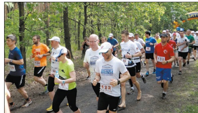
Trasa Biegu po Złote Jabłko jest dobrze przygotowana i oznaczona przez organizatorów

Rozpoczęły się zapisy do IV edycji Biegu po Złote Jabłko, który odbędzie się 14 maja, w Lasach Chotomowskich – bieg główny na dystansie 10 km, bieg rodzinny na dystansie 1 km i Nordic Walking na 10-kilometrowej trasie.