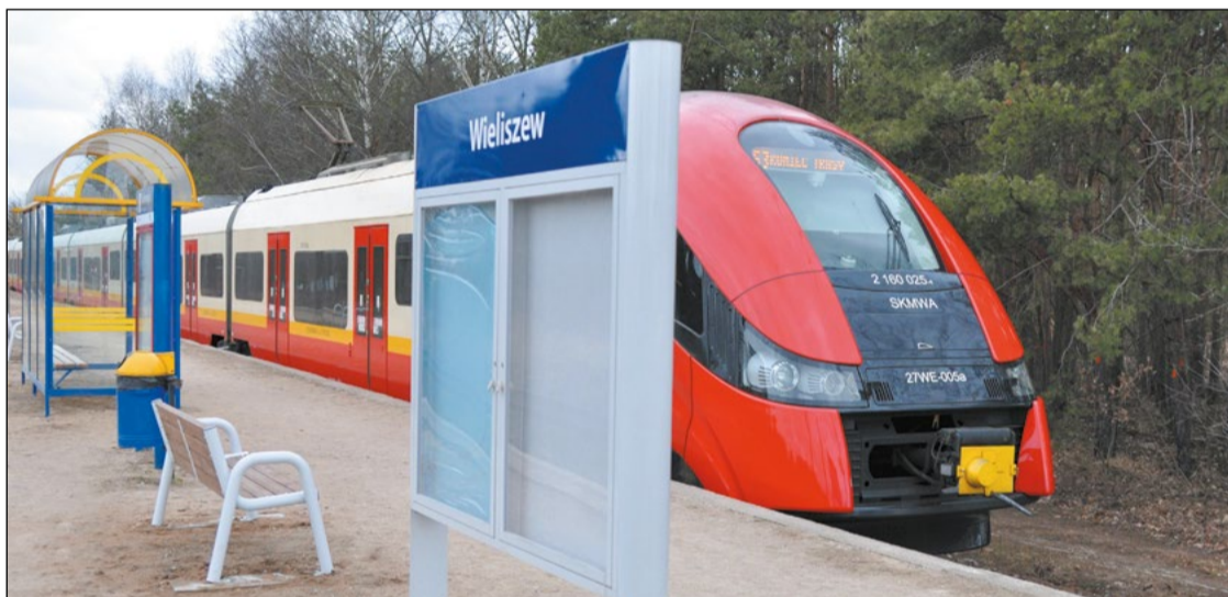
Stacja Wieliszew jest obecnie końcowym przystankiem w połączeniu kolejowym naszego powiatu z Warszawą. Za kilka lat pociągi przejeżdżające przez tę stację dojadą do Zegrza Południowego

Przedsięwzięcie związane z przywróceniem linii kolejowej nr 28 Wieliszew-Zegrze Południowe wchodzi w pierwszą fazę realizacji. PKP Polskie Linie Kolejowe S.A. prowadzą obecnie postępowanie o udzielenie zamówienia publicznego na opracowanie Studium Wykonalności i dokumentacji przedprojektowej dla przedmiotowej inwestycji.