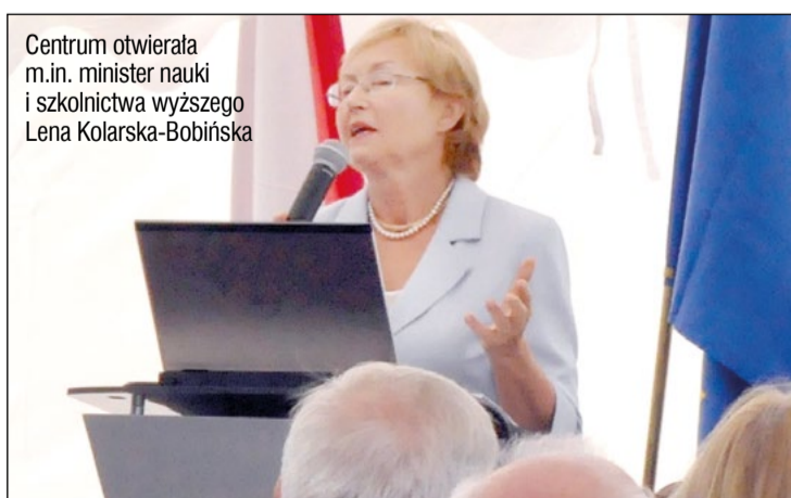
Centrum otwierała m.in. minister nauki i szkolnictwa wyższego Lena Kolarska-Bobińska