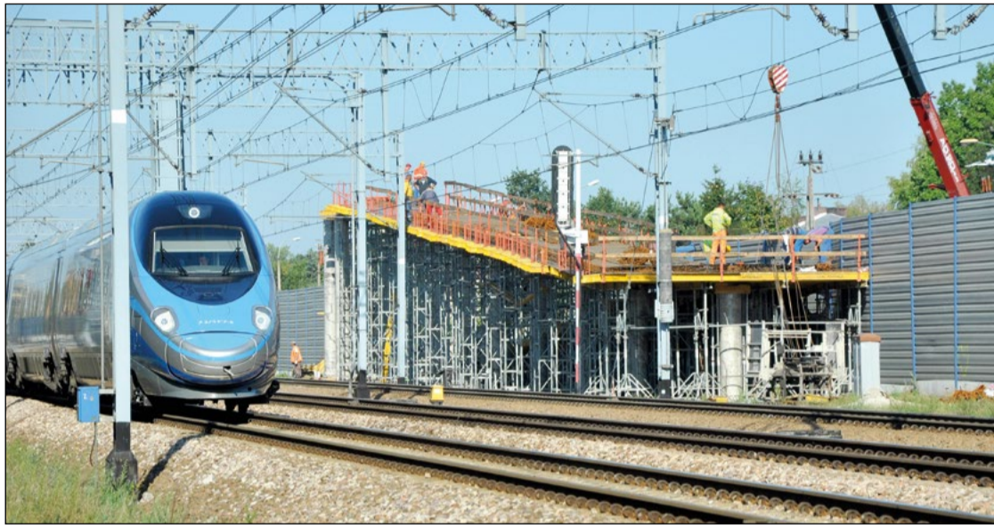
Budowa kładki to przedsięwzięcie niezwykle skomplikowane – nie tylko technologicznie, ale też dlatego, że prace prowadzone są przy normalnym ruchu pociągów

Coraz bliższy jest dzień montażu konstrukcji kładki pieszo-rowerowej nad torami. Od paru tygodni trwają roboty przy budowie pochylni do niej prowadzących.