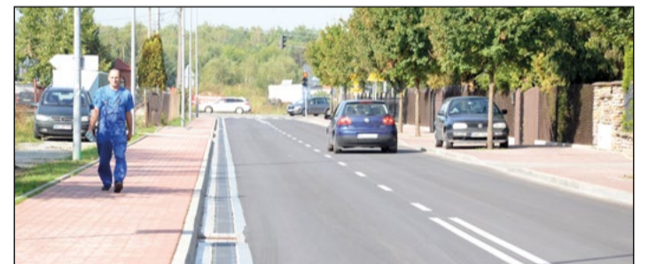
Przy okazji modernizacji drogi na odcinku od Jana Kazimierza do kościoła powstał nowy chodnik

Mieszkańcy Nieporętu mogą już zapomnieć o utrudnieniach w ruchu. Powiat oddał im do użytku przebudowaną w tym roku ul. Izabelińską.