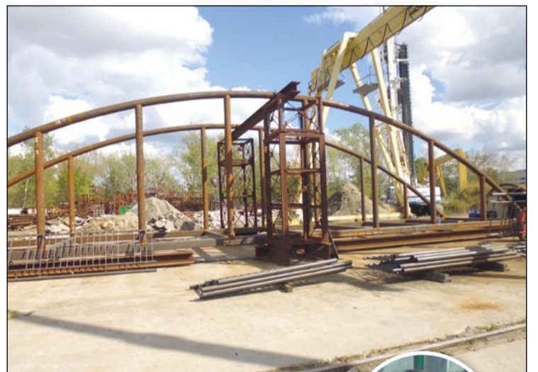
Gotowe elementy konstrukcji kładki czekają na przewiezienie na plac budowy, gdzie będą montowane

Decyzja o zamknięciu przejazdu była słuszna, ale odległość od niego do tunelu jest za duża. Najpierw powinny być udostępnione jakieś przejścia bliżej, a dopiero potem likwidacja przejazdu. w tunelu tworzą się korki i to wszystko nie jest skoordynowane. Teraz robią ul. Nowo-Barską, ale wcześniej ona powinna być budowana, a dopiero potem przejazdu. Z Al. Legionów do sklepu tutaj na Parkowej, przy starym przejeździe, jeżdżę codziennie. Tu są dobre produkty, ale sklep stracił około połowę klientów.