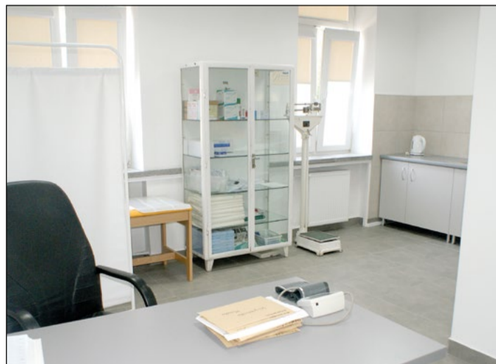
Świeżo wyremontowany gabinet jest wyposażony w nowy aparat KTG i łatwiej dostępny dla pacjentek

Jestem pacjentką tej przychodni od lat i widzę dużo pozytywnych zmian, które zachodzą w ostatnim czasie. Przeniesienie gabinetu poradni ginekologicznej na parter to bardzo dobry pomysł, zwłaszcza, że korzystają z niego kobiety w ciąży jak również seniorci, a dla jednych i drugich pokonanie tak długich schodów może być czasami problemem.