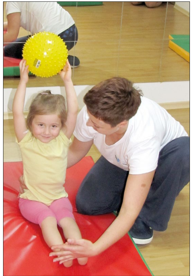
Właściwe ćwiczenia w przypadku wad postawy wykrytych na wczesnym etapie mogą całkiem wyeliminować problem